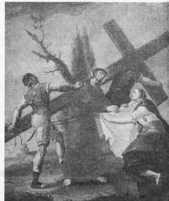
Fortunat Bergant 1766: Križev pot

Oh grešnik, spremisli tvojih grehov ostudnost ter poglej na tvojega odrešenika pohlevnost! Kako sramotno je on kronan in zapljuvan, da ti bi bil zopet v nebesa pripeljan.