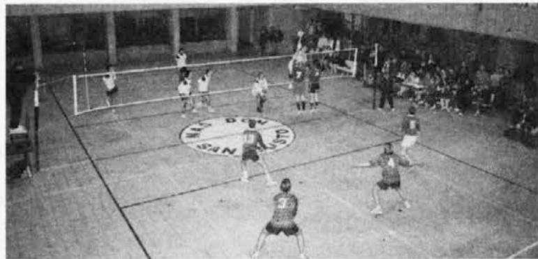
Drugi medkrajevni turnir v odbojki se začne te dni. Preberi članek na 6. strani, tukaj pa priobčujemo sliko z lanskega turnirja