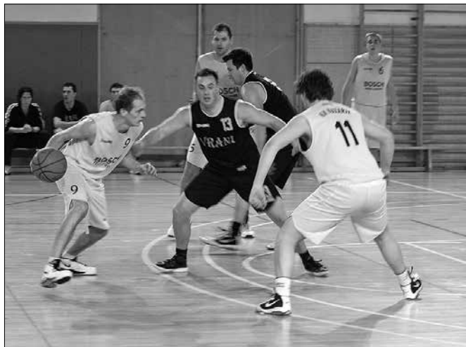
Nazarčanom borbenosti v obrambi ne manjka, samo še v napadu jim mora steči