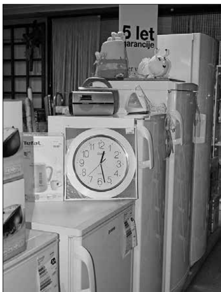
Obvezna garancija na tehnične izdelke še ostaja

Kot ugotavljajo na ZPS, pravice iz naslova stvarne napake veljajo za vse blago, ne le za tehnične izdelke, potrošnik pa jih lahko uveljavlja v roku dveh let od nakupa blaga, ven-