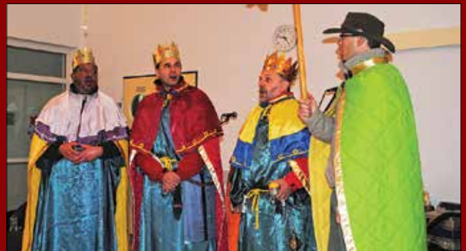
Koledniki Kulturnega društva Jurij so s svojim obiskom razveselili varovance in zaposlene