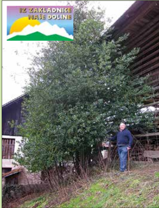
Turkova bodika je veličastnih dimenzij

Žekovec nad Mozirjem je vas bodik in tis. Skoraj pri vsaki hiši imajo posajeni ti dve lepi drevesi. Največja in nedvomno najstarejša je Turkova bodika. Bodika je veličastna po