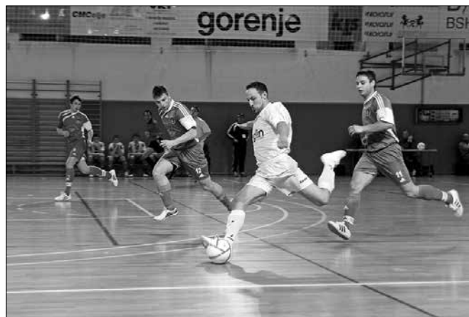
Drugi polčas je bil rezerviran za popolno ofenzivo »graščakov«

ki je tako »graščakom« zadala prvi domači poraz v tej sezoni. Razplet ostalih tekem desetega kroga pa tudi ni šel na roko Pezičevim varo-