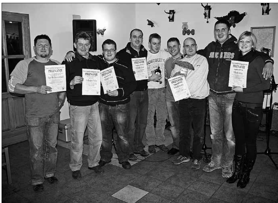
Nagrajenci leta so si svoje nazive pridobili s posebnimi dosežki v zelo posebnih kategorijah