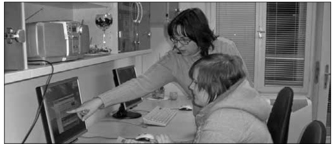
V Centru za samostojno učenje potekajo tečaji, ki jih v sodelovanju z občinami pripravlja Ljudska univerza Velenje, in samostojno učenje posameznikov