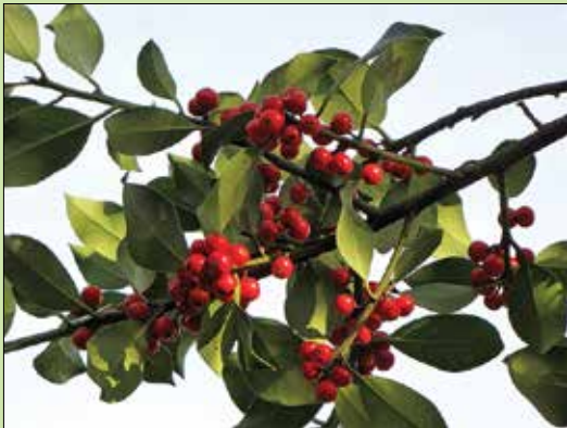
Rdeči plodovi bodike so vaba za oči in za ptice

Bodika je pri nas samonikla drevesna in grmovna gozdna vrsta. Na našem ozemlju je rasla že pred ledenimi dobami, ko je bilo tu znatno topleje. Pred mrazom se je umaknila na jug in se ob otoplitvi ponovno vrnila. Tako vrsto imenujemo terciarni relikv. Že iz tega je razvidno, da so njena naravna nahajališča predvsem na toplih legah. Zaradi izkopavanja je redka in ogrožena, zato je zavarovana. Prepovedano je vsakršno poškodovanje ali ogrožanje. Zavarovan je že od leta 1922 in spada med prvih 23 zavarovanih rastlinskih vrst pri nas. Kljub splošni ogroženosti se na nekaterih rastiščih pojavlja zelo bujno. Razmnožuje se predvsem s pomočjo koreninskih poganjkov in na ugodnih