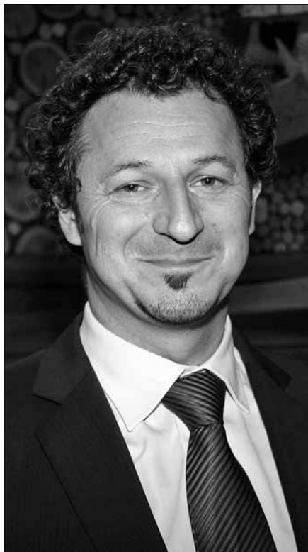
Dr. Patrick Vlačič

Zgornja Savinjska dolina je prometno zelo odrezana od ostalega dela Slovenije. Nekaj večjih podjetij, kot sta KLS Ljubno in BSH Nazarje, številna manjša podjetja in ne nazadnje prebivalci sami potrebujejo ustrezno cestno povezavo. Tudi zato, ker so naravne lepote doline priložnost za razvoj turizma. Od prihodkov tega pa je Zgornja Savinjska dolina, ki po povprečnih plačah krepko zaostaja za ostalo Slovenijo, močno odvisna. Zanimalo nas je, kako bo v prihodnjih letih država poskrbela za »svoje« ceste na našem območju. Povprašali smo tistega, ki je za to najbolj pristojen – ministra za promet dr. Patricka Vlačiča.