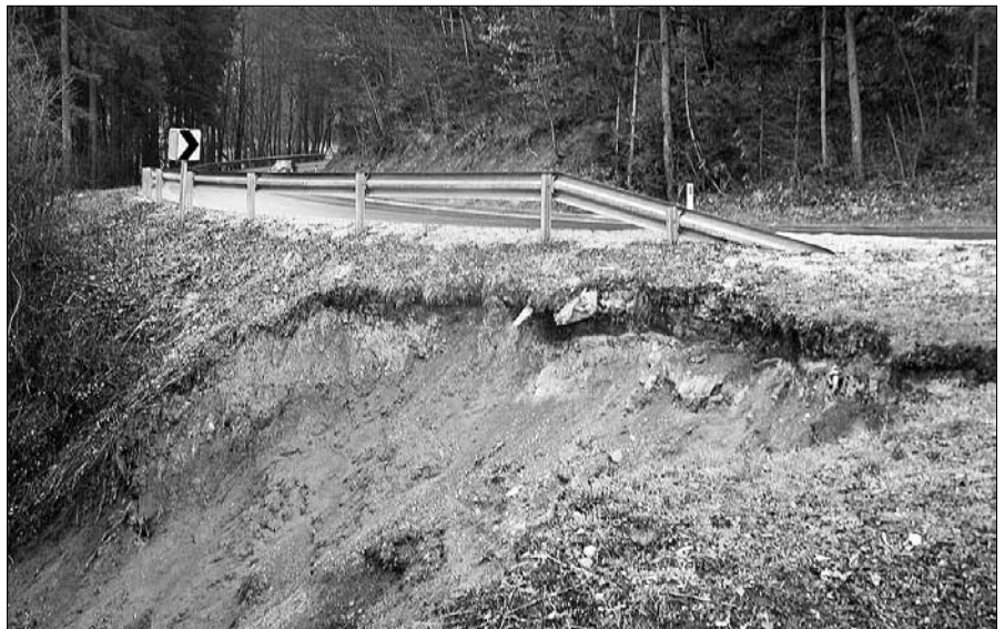
Plaz grozi, da bo poškodoval cestišče in s tem ogrozil varnost voznikov