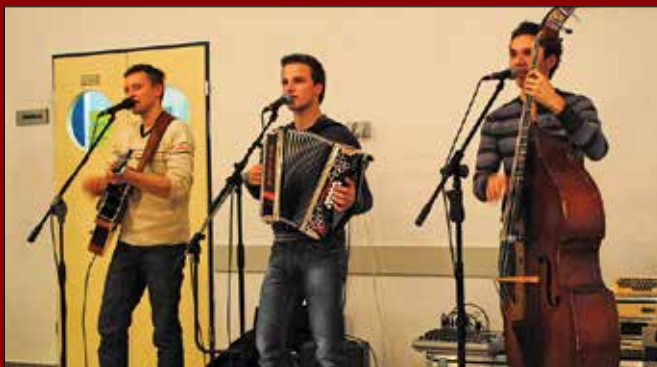
Člani ansambla Golte se povabilu v center vedno radi odzovejo