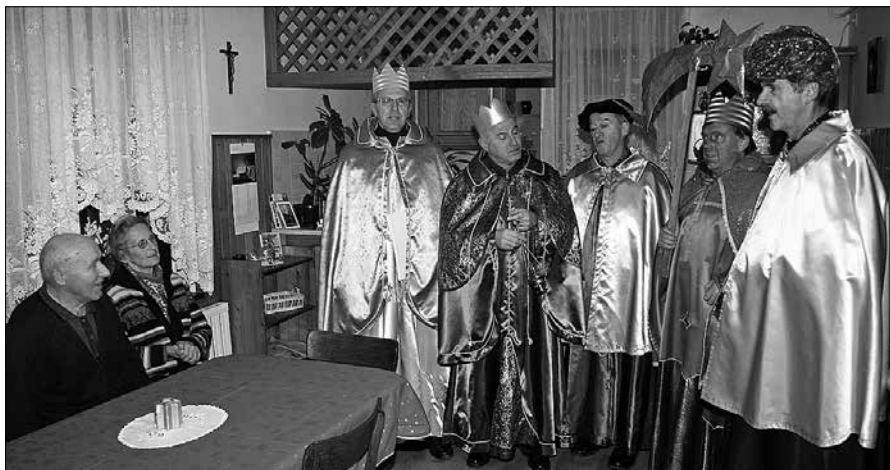
Ločki koledniki so pred dvajsetimi leti obudili običaj obiskovanj družin ob prazniku svetih treh kraljev

Koledniki med obiskom domov pejejo, voščijo srečno novo leto, s kadilnico pokadijo notranjost in zaželijo domačim obilo zdravja in miru. Pred odhodom s kredo nad duri zapišejo kratico