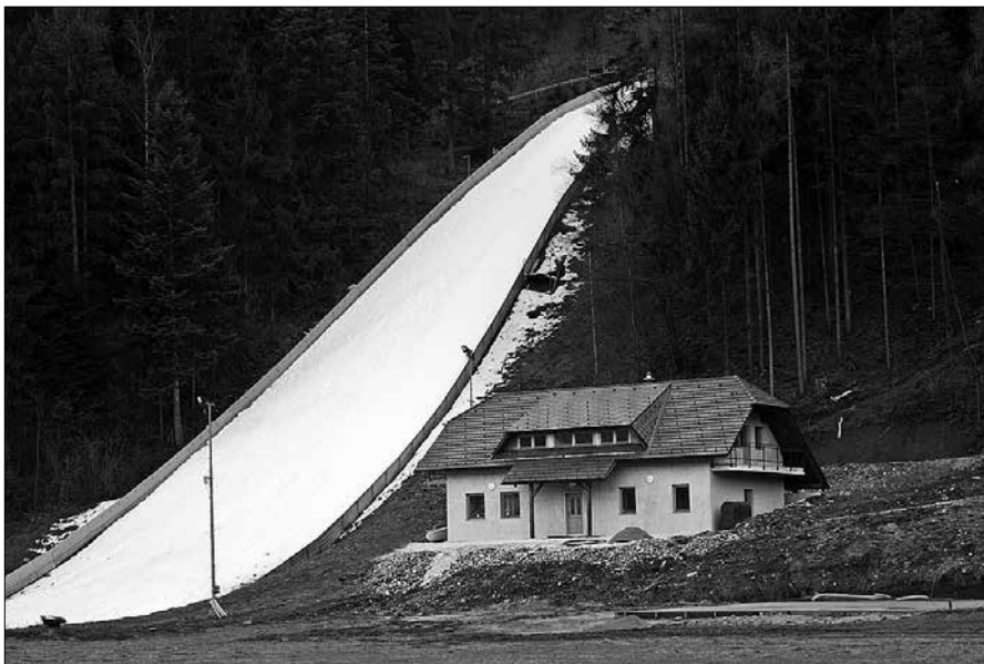
Ob skakalnici so zgradili nov klubski objekt, v katerem bodo prostori za vadbo, garderobe in klubski prostori

in 23. januarja izvedli tekmi za celinski pokal v smučarskih skokih v ženski konkurenci. Na Ljubnem tako pričakujejo od petdeset do šestdeset vrhunskih tekmovalk iz dvanajstih do štirinajstih držav. Med njimi bodo sploh prvič na tem tekmovanju nastopile kitajske skakalke.