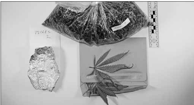
V medijih pogosto zasledimo poročanja o uspešno razkrinkanih narkomanskih navezah, zaseženih laboratorijih in drogih

V primeru, da naletite na katero od zgoraj naštetih težav, vas vabimo, da se oglasite na Inštitutu VIR v Celju, kjer smo strokovno usposobljeni za pomoč tako mladostnikom z naštetimi težavami, kot staršem, ki ste naleteli na takšne težave pri svojem otroku.