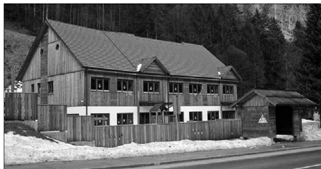
Poslopje solčavske podružnične osnovne šole se z zunanostjo, narejeno iz solčavskega macesnovega lesa, lepo vklaplja v okolje

Gre za poplačilo sofinanciranja določenega v pogodbi v višini 49,5 odstotka vrednosti investicije po normiranih okvirih ministrstva. Občina Solčava se je na razpis za sofinanciranje izgradnje oziroma nakupa šole prijavila leta 2007, ko je bilo poslopje dograjeno in se je v njem pričel pouk. Vrednost objekta znaša okoli 1.060.000 evrov, delež