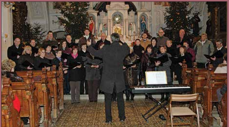
Nastop Mešanega pevskega zbora Kulturnega društva Nazarje