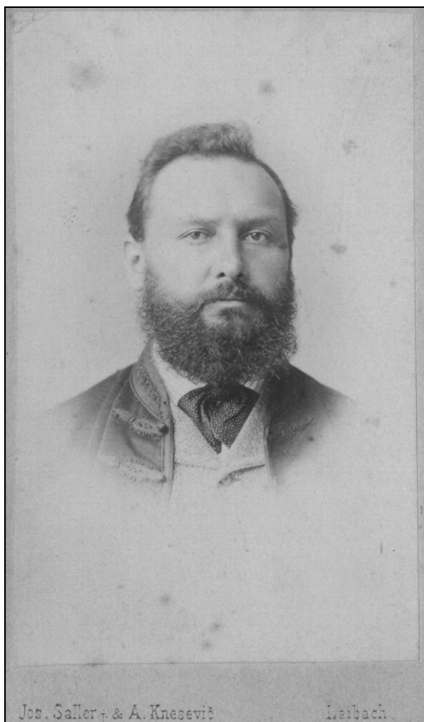
Josip Vošnjak (1834–1911).

Nekaj dni pozneje je Vošnjak v obrazložitvi svojega predloga opozoril, da je bilo na Kranjskem v zemljiško knjigo vpisanih za 54.885.000 gld. hipotečnih dolgov, na katere so tekle obresti po stopnjah od 5 pa vse do 13% in več. Večina teh dolgov je nastala po letu 1848. Hkrati je opozoril na problem izseljevanja "iz dežele, kar bi se gotovo ne godilo tako obilno, ko bi se kmetje mogli preživeti doma". Po statističnih podatkih za leto 1879, ki jih je navajal Vošnjak, je bilo od 484.000 prebivalcev Kranjske 54.600 "kmetijskih posestnikov". Ob teh je bilo še 113.300 poslov in 158.000 družinskih članov. Vseh ljudi, ki so se ukvarjali s kmetijsko dejavnostjo je bilo 337.000 (69,5% vseh prebivalcev v deželi). 11