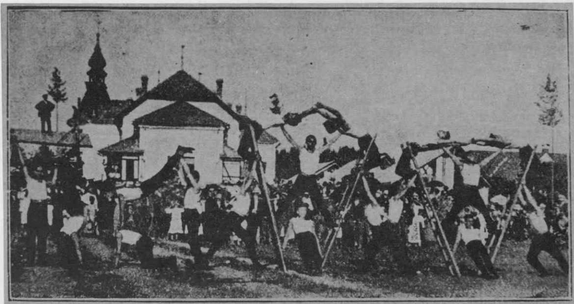
Nastop skupine naraščajnikov z lestvami ob otvoritvi Sokolskega doma v Domžalah leta 1911

območja Doba in Moravč do Črnega grabna.