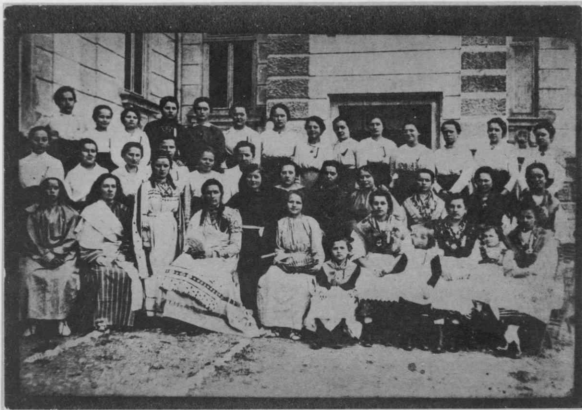
Dramska skupina Katoliškega izobraževalnega društva v Domžalah pred prvo svetovno vojno

prosvetnem področju. Leta 1897 je Slovenec v članku »Česa nam je trava«, prvič krepko podčrtal, da je treba v vsaki župniji ustanoviti bralno društvo na katoliški podlagi. 17 Nekaj let kasneje (1902) je tudi Slovenski list, glasilo krščanskih socialistov, agitiral za ustanavljanje takih društev in pri tem poudaril, »da živijo Slovenci v kritičnem času, ker jih ogrožajo Nemci in Italijani in ker se hkrati bije tudi boj med političnima strankama. Slovenski jezik se bo ohranil le, če se ljudstvo gospodarsko okrepi in se otrese tujega kapitala.... Naš čas je čas kuturnega boja. Po farah naj bi ustanovili izobraževalna društva, ki naj bi s socialnoverškimi predavanji, poukom, zabavami in širjenjem ustreznih knjig in časopisov ohranjala ljudstvu vero in narodnost.« 18