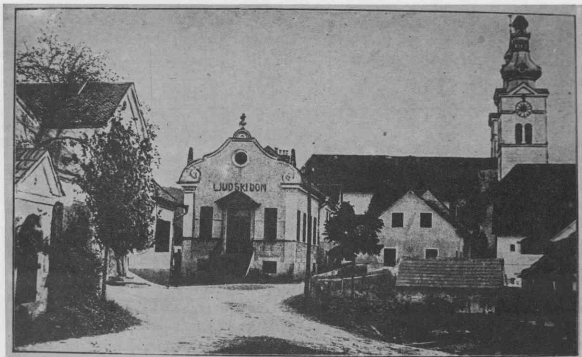
Ljudski dom v Moravčah

Načrti za ustanovitev sokolskega društva so obstajali že pred letom 1905. Pobuda je prihajala predvsem iz vrst študentske mladine, ki je pripravljala v večjih krajih na domžalskem območju razne proslave v čast pomembnejših domačinov, shode, gledališke igre in zabave. Posebno vzpodbudo pa je predstavljalo agilno sokolsko društvo v Kamniku, ki je že v prvih mesecih svojega delovanja (ustanovljeno je bilo 3. decembra 1904) razvilo bogato dejavnost. 26