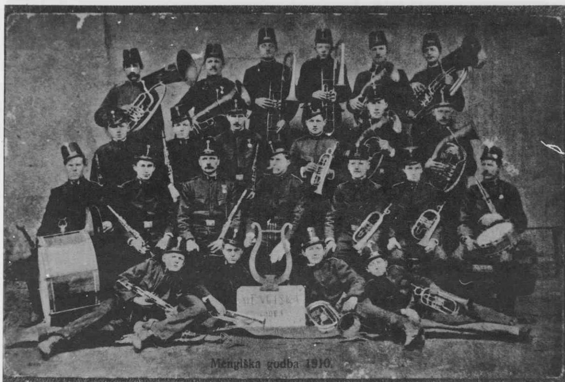
Mengeška godba leta 1910