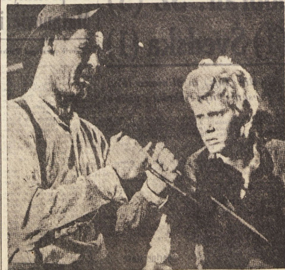
PRIZOR IZ «MALE NJIVE». LEVO ROBERT RYAN, DESNO MICHAEL LANDON

Obilo ploskanja po Jančevih «Črni biserih» - Razen Silvine Pampinini ni v Benetkah se nobene znamenite filmske zvezde - Giné Loblbrigide ne bo, ker bi jo prihod stal nič manj kot pet milijonov