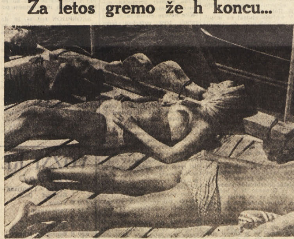
Vročni dnevi so za nami. Čeprav je sonce še močno, se nagibamo k hladni jeseni. Kdor le more, izkoristi vsak trenutek

«Za letos gremo že h koncu...» Vročni dnevi so za nami. Čeprav je sonce še močno, se nagibamo k hladni jeseni. Kdor le more, izkoristi vsak trenutek