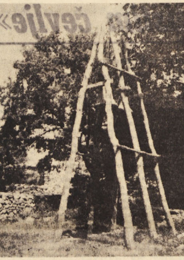
Vaški zvonik na Vrhu