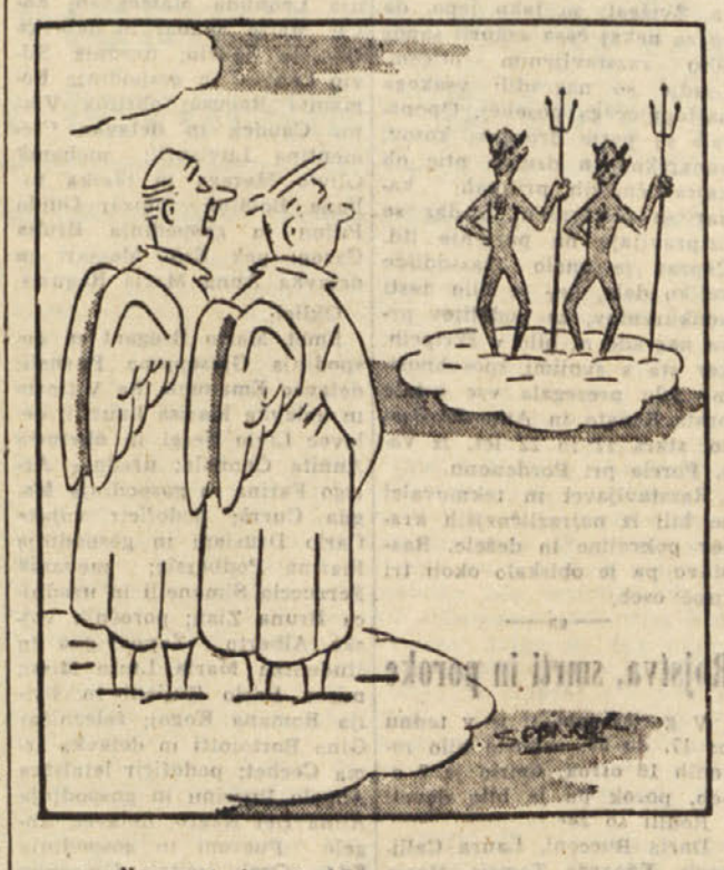
No, spet dva turista.

Čebele niso od vekomaj narabale medu. V davnih časih je bilo življenje že samo po sebi sladko, da ljudje niso vedeli, kaj naj počno z medom. Čebele so se samo potepale od cveta do cveta