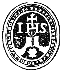
1 Pečat jezuitskega kolegija v Gorici

Kdaj je glasbena zbirka celjske opatijske cerkve začela nastajati, ni mogoče reči, v grobem zajema čas druge polovice osemnajstega in prve polovice devetnajstega stoletja. Preživela je torej veliki požar, ki je opustošil Celje na veliki četrtek 5. aprila leta 1798 in med številnimi mestnimi zgradbami uničil tudi župnišče, kaplanijo in mežnarijo, cerkev pa poškodoval. Vendar zbirka ni prispela do nas povsem neokrnjena. Nekatere skladbe je nagrizel zob časa, izgubili so se jim posamezni glasovi ali jim manjkajo naslovne strani, da bo težko dognati njihove avtorje, in po ureditvi gradiva je ostalo dva zavoja neidentificiranih fragmentov („membra disiecta“). Kljub temu je zbirka dokaj velika, ena obsežnejših na našem ozemlju, saj šteje 189 bibliografskih enot. Od tega je 170 rokopisov in 19 tiskov.