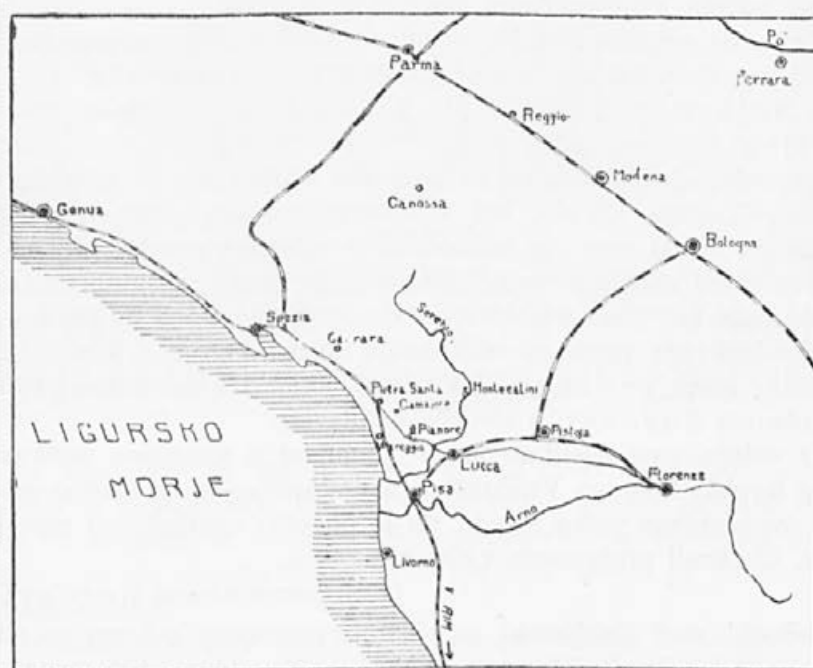
Toskansko v Italiji.

Godovni dan presvite cesarice Cite, t. j. dan 27. aprila, se bo vsled odredbe c. kr. ministrstva za nauk in bogočastje vsako leto po celi Avstriji slovesno praznoval. Tako tudi dan 9. maja vsakega leta kot rojstni dan cesarice Cite.