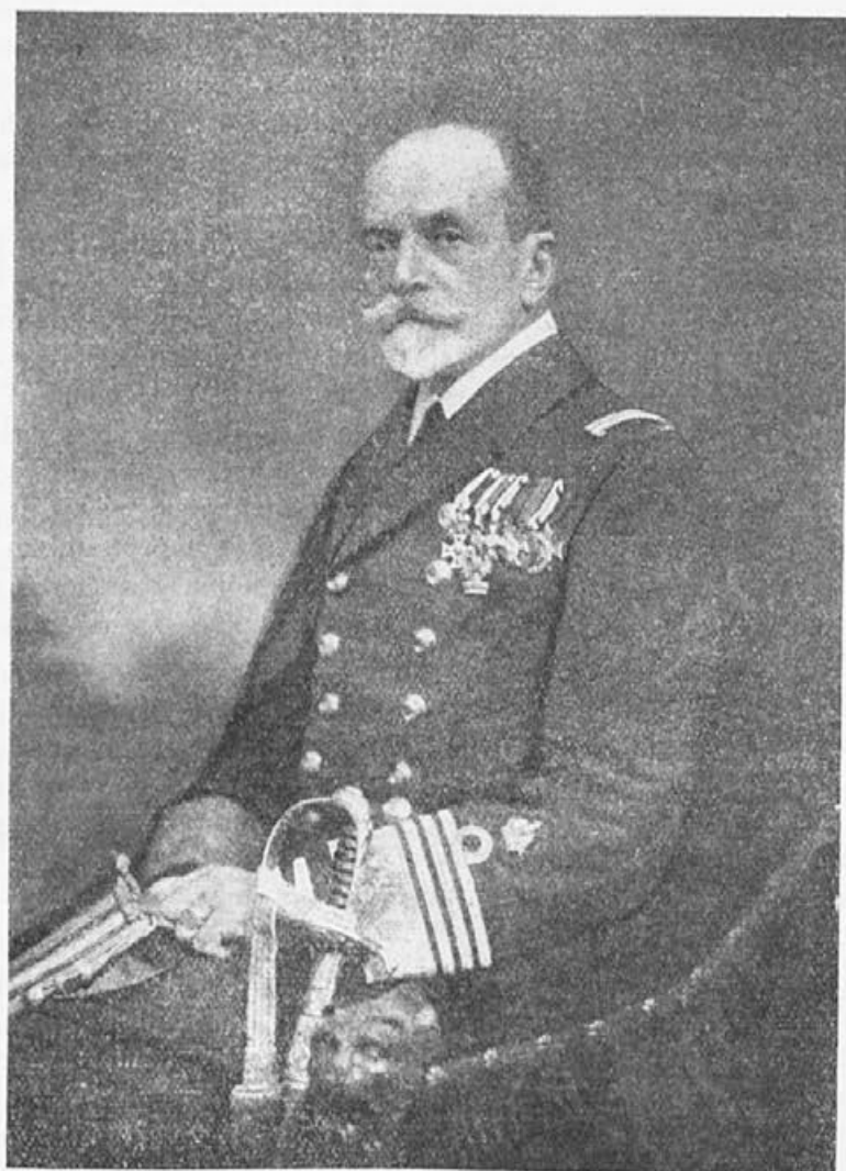
† Veliki admiral Anton Haus.