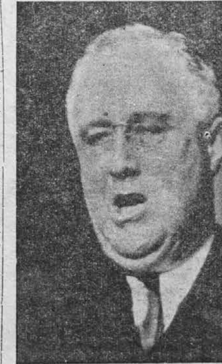
Roosevelt, predsednik Zedinj. držav nik Združenih držav, Roosevelt. Zato je tudi že dvakrat bil z veliko večino izvoljen predsednikom in bo brezdvoma tudi v tretje, če bo kandidiral.

Dirigirano ali vodjeno gospodarstvo imajo vse totalitarne države ter več ali manj tudi druge. Trgovci kupujejo in prodajajo blago po navodilih in nadzorstvom države. V Rusiji je direkten kupee in prodajalec država sama, ker imajo ali skušajo uvesti popoln kulturni, gospodarski in politični sistem. V Nemčiji in Italiji ni država posredni kupee in prodajalec, a je vse gospodarstvo pod strogim državnim nadzorstvom. V takozvanih demokratičnih državah pa je bila trgovina in gospodarstvo popolnoma svobodno in je vsak trgovec poljubno kupoval, kjer je hotel in prodajal komur je hotel, ter kakor je vedel in znal. Razumljivo, da je bila vlada od teh ljudi postavljena in tudi bila pod vplivom ljudi, ki so stali za to ali ono stranko, ki jim je služila predvsem v njihove profitne svrhe, dasi so govorili in obljubljali seveda drugače. Prvi predsednik demokratičnih držav, ki ni hotel politike povsem tako voditi kakor so zahtevali denarniki in njihovi interesi, je predsednik