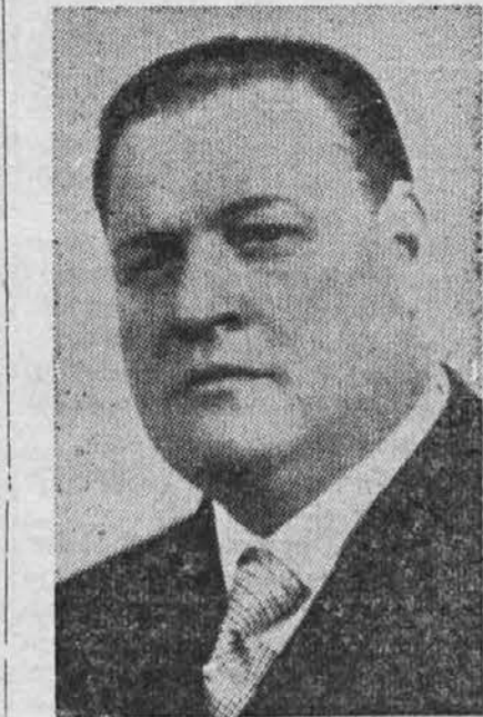
Dr. Ortiz, državni predsednik slab mož. V soboto zvečer, spričo razburkanih volilnih duhov po deželi, je imel zelo lep radijski govor, ki je med drugim dejal, da ga ne zanima toliko sreča kake stranke kakor sreča in napredek vsega naroda.

Tudi o predsedniku Argentine dr. Ortizu nemore nihče trditi, da bi bil