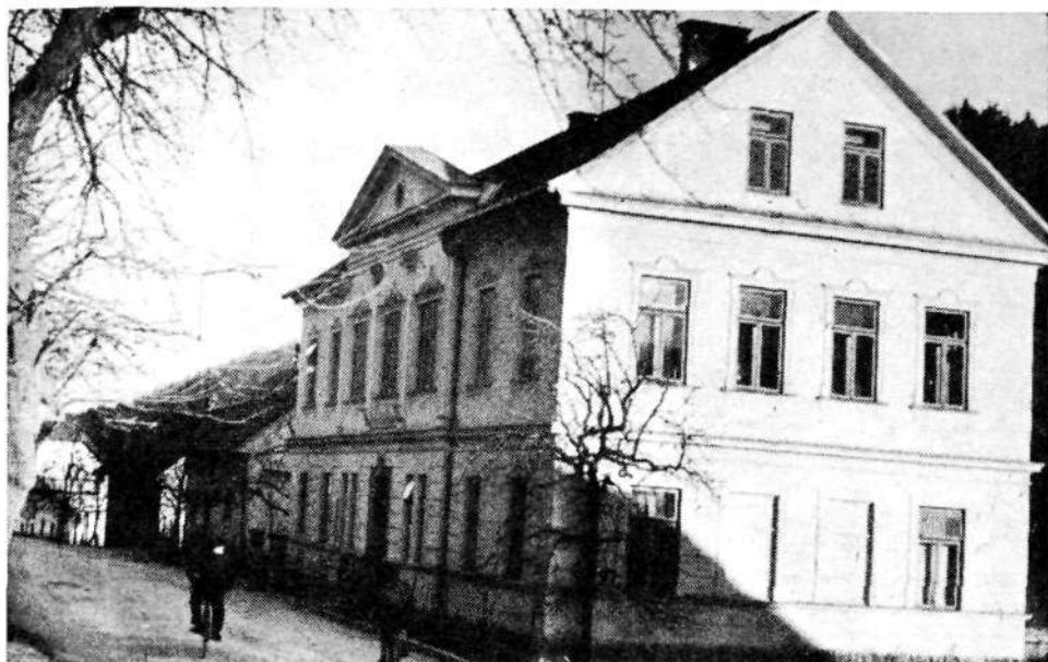
Solsko poslopje v Poljanah, zgrajeno leta 1908 (dokument, zbirka SSM)

Končno so 20. 12. 1906 z javno »zmanjševalno dražbo« (izbiranjem najcenejšega izvajalca del) začeli graditi šolo. Določeni rok gradnje je bil dve leti in res je bila 20. 10. 1908 »kolavdacija« (danes bi temu rekli »prevzem«) novega šolskega poslopja. Pouk se je v njem začel že 31. oktobra 1908, blagoslovili pa so ga z nekoliko zamude 15. novembra.