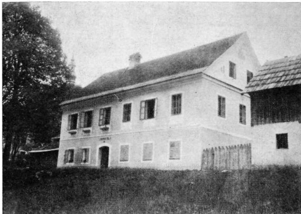
Kupčeva hiša v Poljanah, v kateri so začeli s poukom v šolskem letu 1880/81