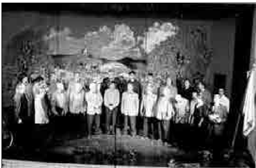
PD Lipa leta 2008 ob menjavi generacij.