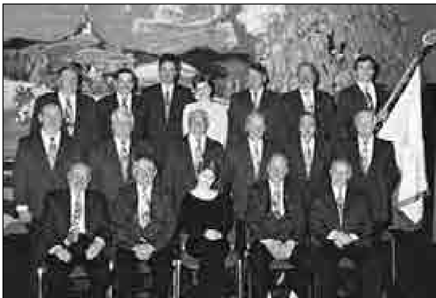
PD Lipa ob 120-letnici (arhiv PD Lipa Litija).