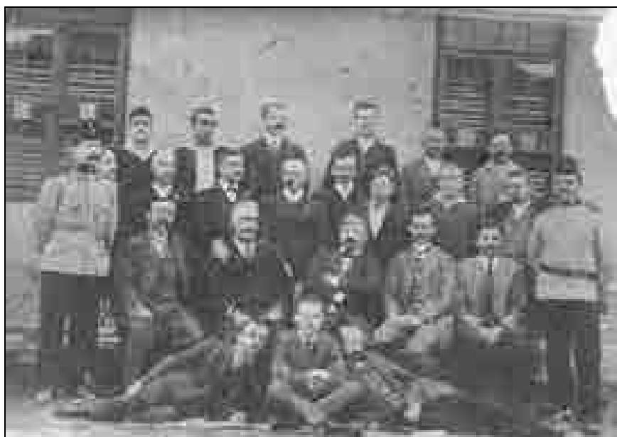
Pevsko društvo Lipa leta 1914 ob mobilizaciji.