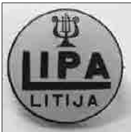
Društvena značka iz leta 1925.

Po odmevnem praznovanju 45-letnice delovanja je društvo očitno imelo nekaj težav, predvsem s pomanjkanjem zborovodij. V zapisniku 7. redne seje upravnega odbora društva dne 24. avgusta 1932 lahko preberemo naslednji zapis: »G. Pertot izjavlja, da z današnjim dnem odloži mesto pevovodje pevskega zbora. Svojo demisijo motivira s tem, da s tako nediscipliniranim zborom ne more več delati. Pevci nimajo nobenega smisla za red in točnost. Na predlog odbora, da bo vse slabe člane izključil ter da naj še dalje vodi zbor, izjavlja, da pri tako zdecimiranemu zboru