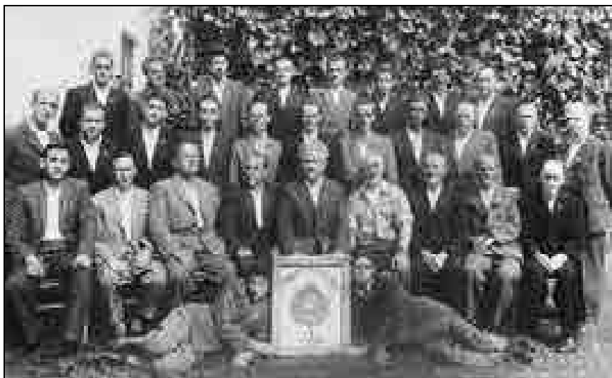
PD Lipa Litija leta 1952.