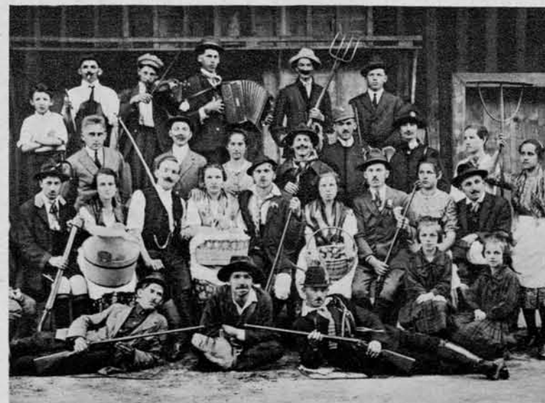
Igralci in igralke «Divjega lovca»

Zelenica je planina med Begunščico in Nemškimi vrhom.