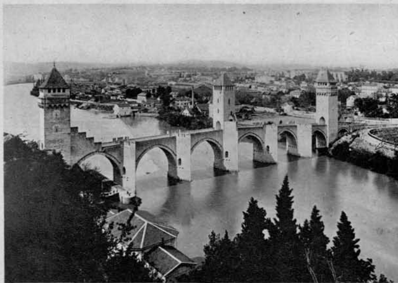
Pogled na mesto Caņors

(na dvorišču Louvrea), z reliefi, ki proslavljajo Napoleonove zmage nad Avstrijci.