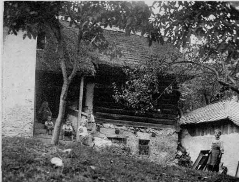
Rojstna koča «Divjega lovca» v Doslovičah

Hiša stoji v Doslovičah pri Breznici, a Finžgarjev oče jo je že leta 1892. prodal in si postavil v Breznici novo.