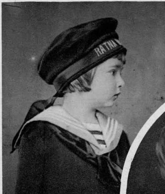
Slika na levi: Pokrovitelj «Jadranske Straže»