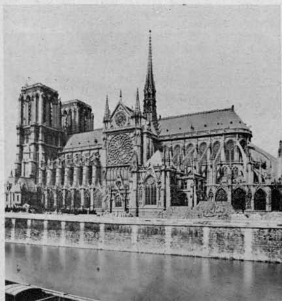
Notre Dame v Parizu

v Parizu (nasproti Louvrea) iz konca srednjega veka, cerkev pa je stala tu že v VII. stoletju.