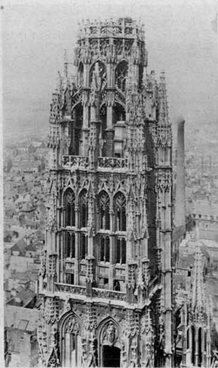
Čudoviti stolp katedrale v Rouenu

(pogled od strani); ta prekrasna stolnica, zidana od 1163—1230, je pravo čudo franc. gotskega sloga.