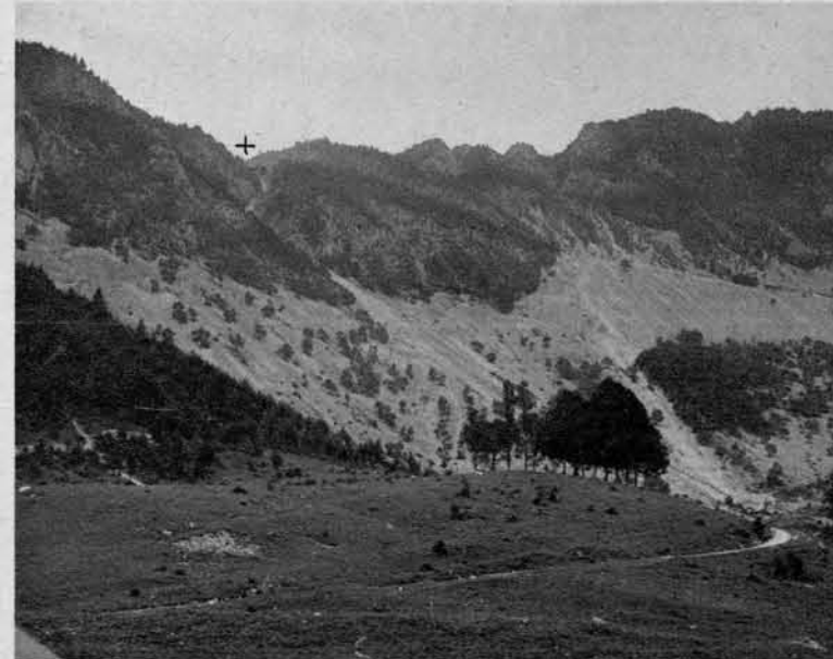
Pot čez Smokuški vrh (X) na Zelenico

ki je leta 1902. kreirala na ljubljanskem odru vlogo Majde.