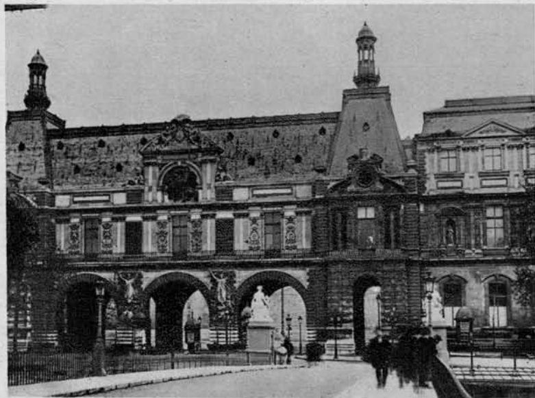
Del Louvrea, nekoč bivališče francoskih kraljev

Z veliko Francijo nas veže iskreno in prijateljsko zavezništvo, zato jo zadnja leta Slovenci vedno raje posejajo.