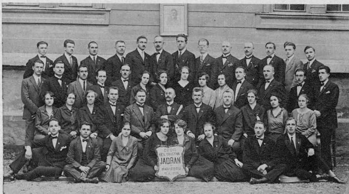
Zbor pevskega društva «Jadran» v Mariboru (ustanovljen 1919), ki je samo lansko leto 23krat javno nastopil.