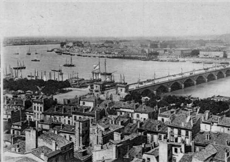
Pristanišče Bordeaux ob Atl. oceanu

ob reki Lot. To mesto šteje krog 14.000 prebivalcev in je znano po svoji industriji plutevine in klobukov.