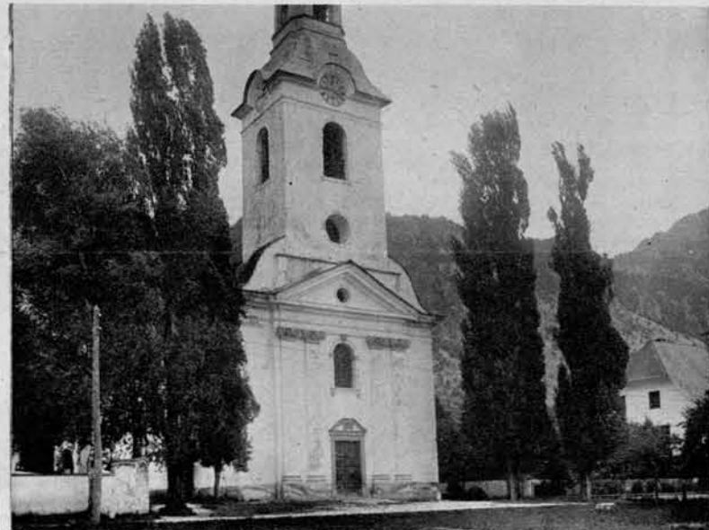
Brezniška cerkev , pred katero se vrši začetek prvega dejanja «Divjega lovca» (prizor s piruhi).