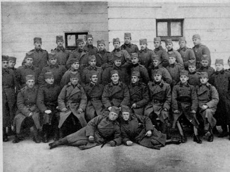
Skupina slovenskih fantov dijakov