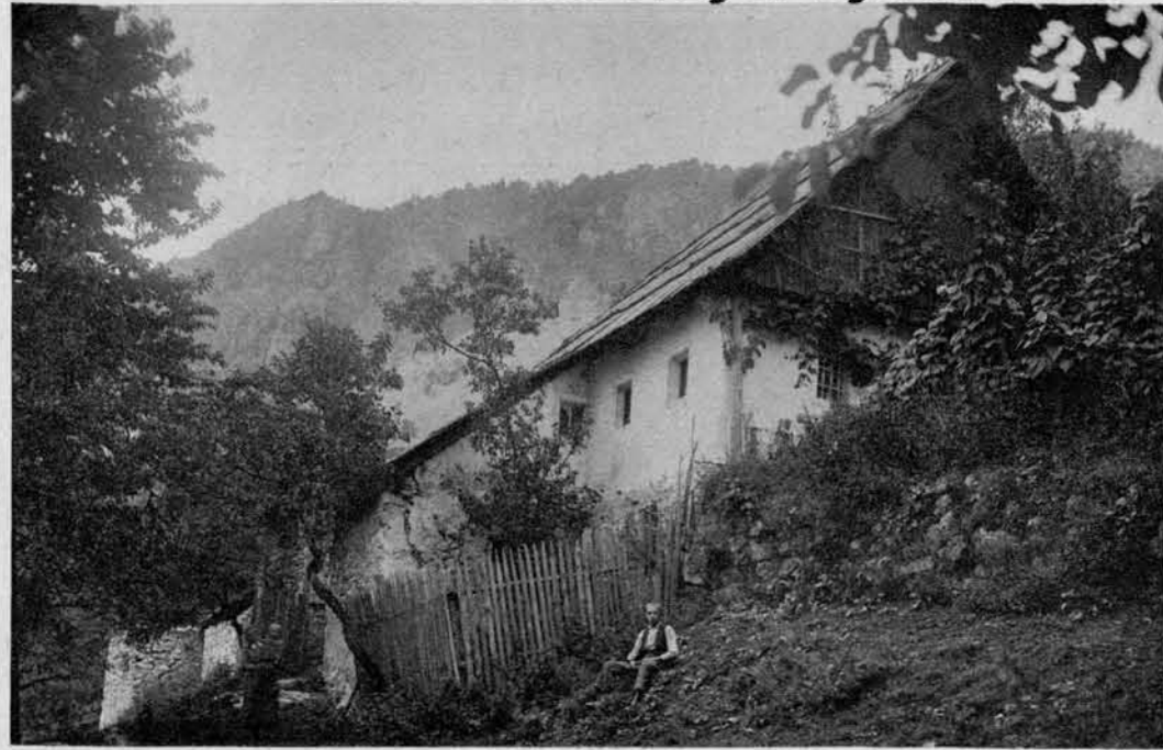
Rojstna hiša Fr. S. Finžgarja

je pod našim veličastnim gorenjskim Stolom, ki se dviga ob robu prelepega brezniškega polja, kakor nam ga kaže naša spodnja slika. — To polje nam je rodilo Preserna, Čopa, Janšo, Knafnja, Pogačarja in mnogo drugih znamenitih mož; iz raznih vasi na tem polju je namreč izšlo v preteklem stoletju nad sto sinov, ki so kot izobraženci (duhovniki, profesorji, uradniki) delovali med našim narodom.