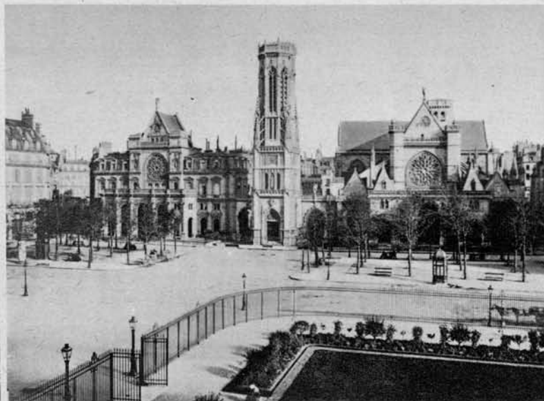
Prekrasna cerkev Saint Germain

sedaj hram najznamenitejše umetnostne galerije sveta.