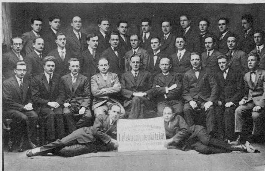
Udeleženci elektromonterskega tečaja