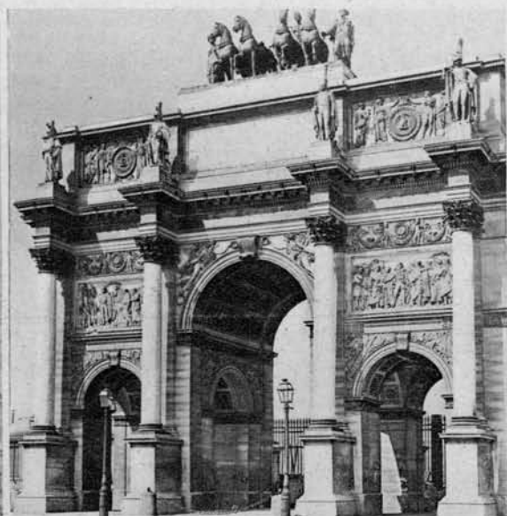
Arc du Carroussel

kjer so Angleži leta 1431. sežgali Devico Orleansko, ki se je borila proti njim.