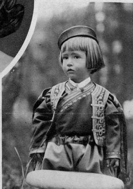
Slika na desni: Črnogorski junak