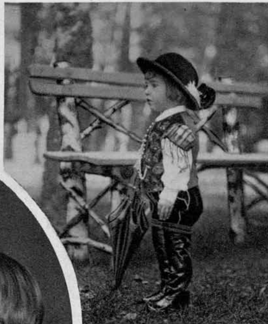
Slika na desni: Gorenjski fant