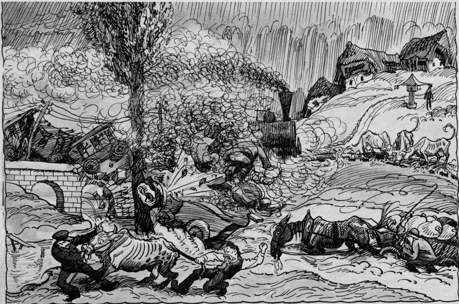
Slika elementarnih nesreč in posledic bivših PPŽ in RR uprav.