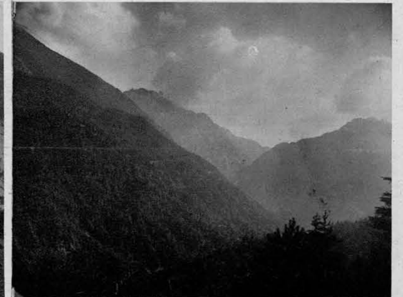
Pogled profi Zelenici

Janez je ubežal biričem od Smokuškega vrha po pobočju na levo proti kovačnici v Zabreznici.