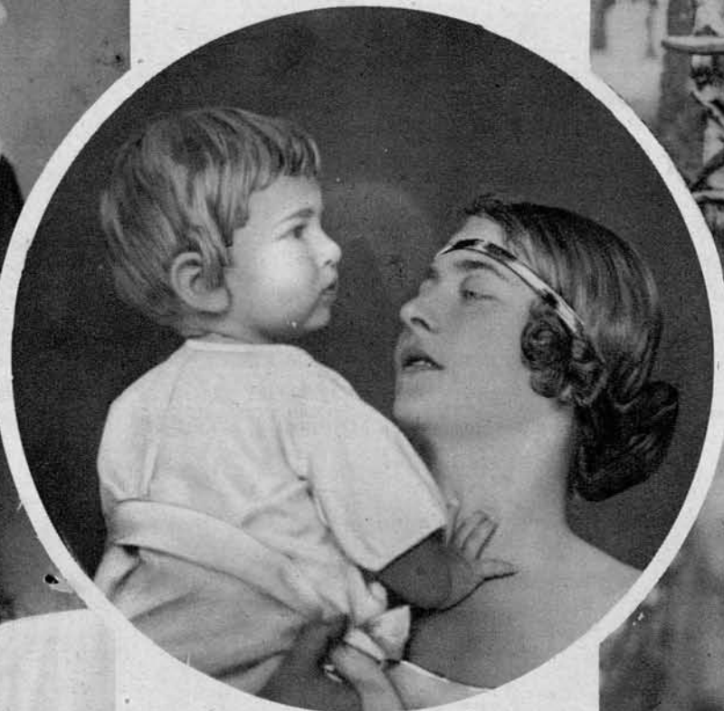
Naša kraljica Marija s prestolonaslednikom Petrom