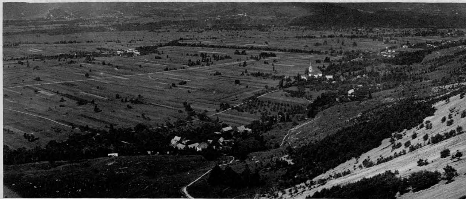
Pogled na brezniško polje (s pobočja Peči)

Spredaj Dosloviče , desno Breznica ; sredi polja Drba , v ozadju na levo Bled , desno Gorje , zadaj Pokljuka in Triglav (v megli).