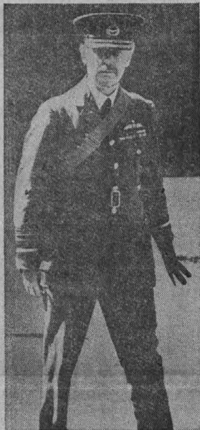
Hugh Dowding, maršal angleške zračne sile, kateri se ima Anglija doslej zahvaliti, da ni bila še invadirana po Nemčiji.