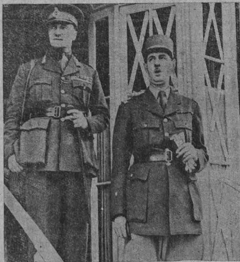
Na sliki sta general Charles de Gaulle (na desni), voditelj čet svobodne Francije, poleg njega pa angleški general F. L. Spears, na katera valjho odgovornost za neuspeh pred Dakarjem.