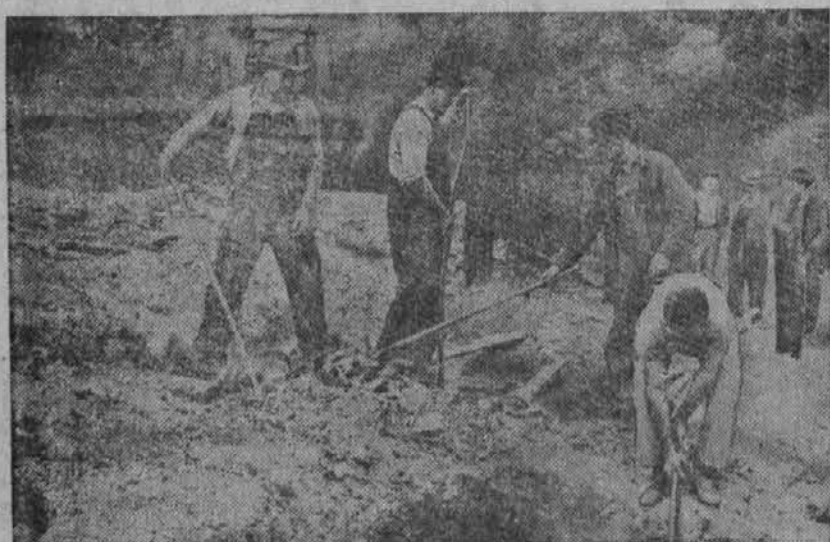
Na sliki vidimo delavce, ki grebejo po pogorišču, kjer je stala šola, v kateri je zgorelo devet otrok. Pogorela šola je stala v bližini Jacksona, Ky.