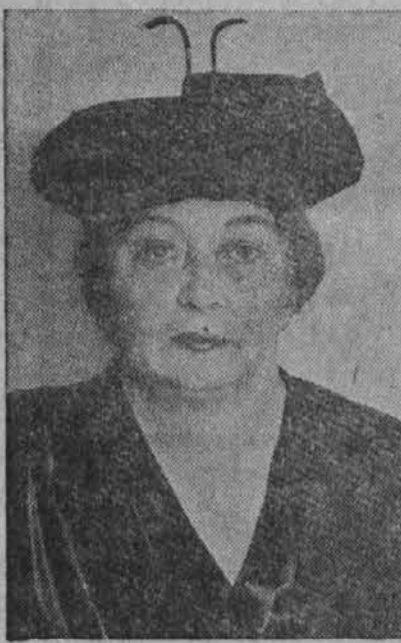
Slavna norveška pisateljica in kriminalnih zakonov na Harvardu vseh učiteljev, je dobil nalog, do, Sigrid Undset bo predavala naj s sodelovanjem uradnikov dne 22. oktobra v New Yorku o "Skandinaviji in vojni."