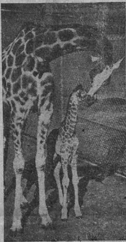
Gornja ljubka slička je bila posneta v zoološkem vrtu v San Franciscu. Na sliki je žirafa in njen mladič, ki je že šest čevljev visok.