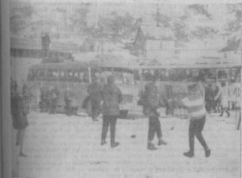
Z dvema avtobusoma so vozili otroke na smučanje v Črno