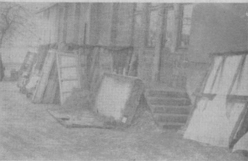
Za obrtno delavnico »Steklar«, ki je v združnem domu, je vedno razmetana embalaža. Ali je ne bi mogli vskladiščiti in urediti okolico lokala?

no urejene (kamnite ali betonirane s pokrovom). Kaj pa preostali prebivalci? Našteli smo štirideset družin, ki nimajo smetnjakov in ne smetiščnih jam. Vprašali boste, kam odlagajo odpadke. Tudi mi smo jih vprašali. Veliko jih je naivno odgovorilo: »Smeti? Saj jih nič nimamo! Od česa bi jih