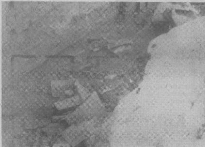
Potok ob Ljubljanski cesti, ki preide v cevi južno od Chrommetala, je poln raznih gospodinjstkih odpadkov