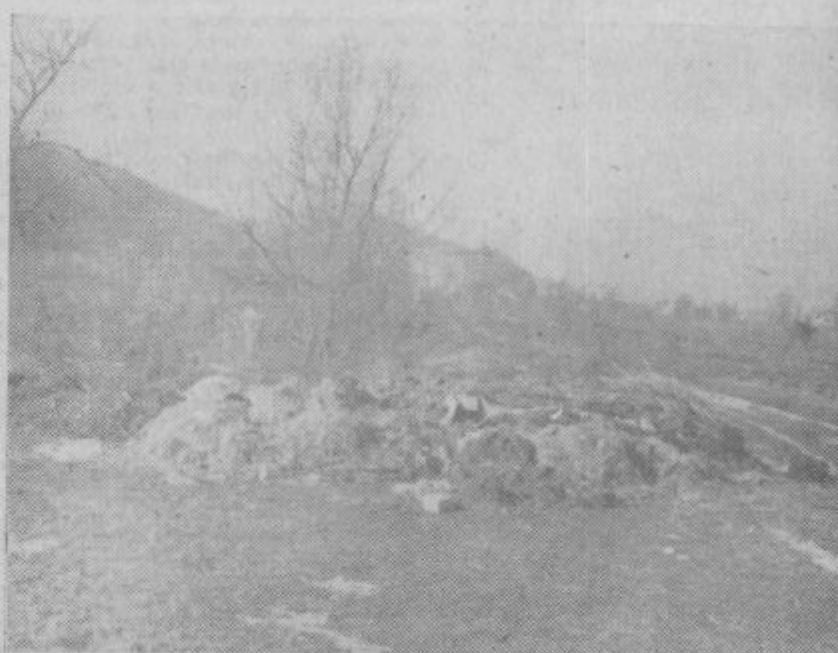
Na travniku za hišo na Celjski cesti 39 je velik kup smeti. Teh ne bi bilo, če bi imeli posodo smetnjake