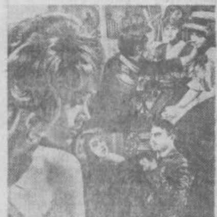
Francoski barvni film »Krog ljubezni« bodo vrtili 11. in 12. 2. v kinu »Svoboda«.