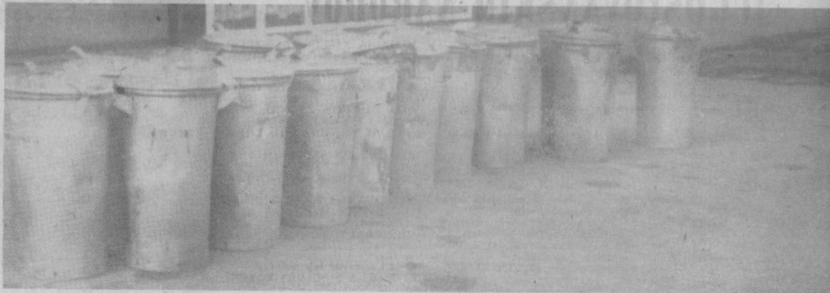
Prebivalci starega Velenja! Upoštevajte zahteve in nabavite najkasneje do 1. marca letos takšne smetnjake

Kmalu bomo spet sprejeli prve obiskovalce v našem mestu. Letos, v turističnem letu, si bomo posebno prizadevali, da bomo še potencirali vse tiste posebnosti Velenja, zaradi katerih je popularno, saj si obetamo veliko turističnih prireditev, med drugim tudi izseljenski piknik v prvih dneh julija.