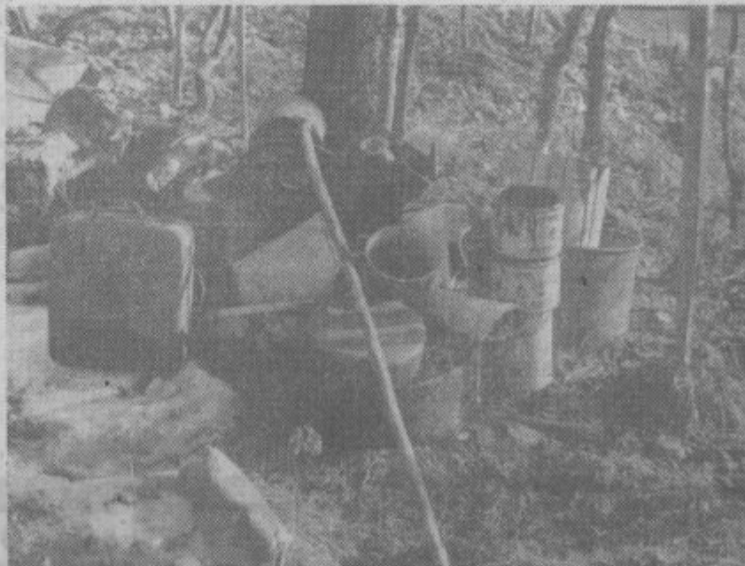
Nekateri prebivalci iz starega Velenja pravijo, da ne potrebujejo smetnjakov. Takšne in še večje kupe smeti pa najdemo povsod v starem Velenju. Preberite zapis in opozorilo na 4. strani.