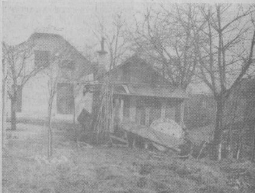
V tej hiši na Celjski 39 nimajo smetnjakov imajo pa pred hišo velik kup smeti!

Letos je prav leto turizma in naj bo naša skupna skrb in prizadevanje, da bodo vsi kraji v naši občini imeli tak zunanji izgled, ki bo privlačen za vsakega obiskovalca, kajti veliko lahko storimo, ne da bi bila za to potrebna kakršnakoli sredstva.