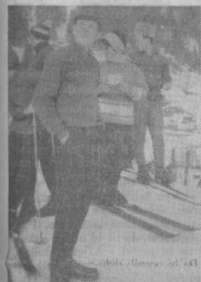
»Strogi« sodniki so merili čas mladim tečajnikom

KONCERTNA NARODNA IN PLESNA GLASBA VSAK DAN, RAZEN PONEDELJKA