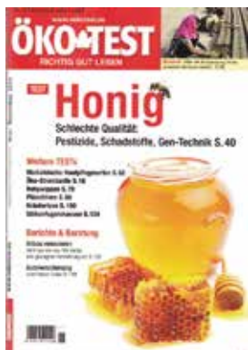
Revija Öko test, namenjena porabnikom

dinske alkaloidne PAs (pri nas jih vsebuje nektar gadovca, boreča, konjske grive in šentjacobovega grinta, ker pa teh rastlin v Sloveniji ni veliko, za naše porabnike ni nobene nevarnosti; op. p.). Toda preseñenje je bilo veliko, ko so v vzorcih nemškega medu oljne ogršãice in v spomladanskem cvetliãnem medu, ki so ga ãebele nabirale v bližini