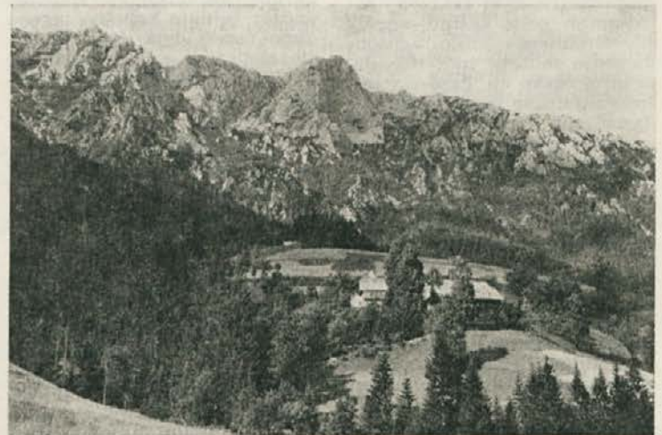
Iz doline Tople

V našem podjetju so združeni številni delovni in strokovni profili. Poleg gozdnih obratov, so tu še gradbeni, strojni, projektni in taksacijski. Tako imamo možnosti za raznovrstne pridobitne dejavnosti. Prav v tem je poleg mentorstva nad gozdovi tudi delček vzroka, da