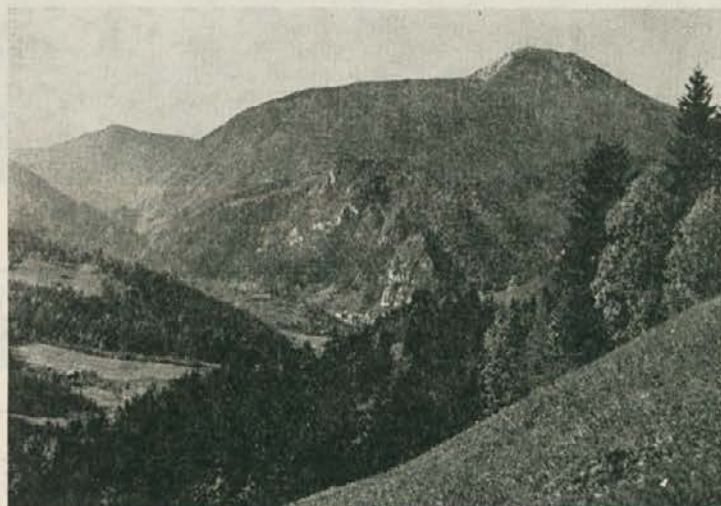
Okolica Črne na Koroškem