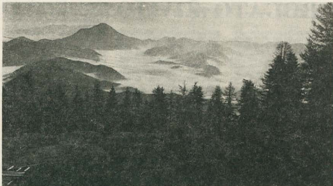
Med Peco in Pohorjem