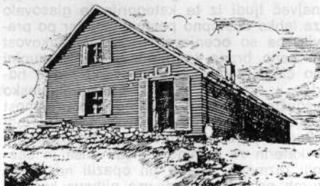
Zasavska koča na Prehodavcih (2071 m — perorisba Antona Rojca)

V vodstvu Planinske zveze Slovenije so se dogovorili, da bodo lastnikom in oskrbnikom najbolj priljubljenih in najbolj go-