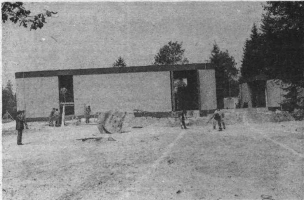
Vodarna je sredi zelenja, saj so se trudili, da so pri gradnji podri čimmanj dreves. Stene objektov so pobarvali v barvi vode – svetlo in temno modri in ko bo ozelenela okolica, bo okolje vodarne zares urejeno. Na sliki sta osrednja objekta, v katerih so uprava, energetske in tehnološke naprave.