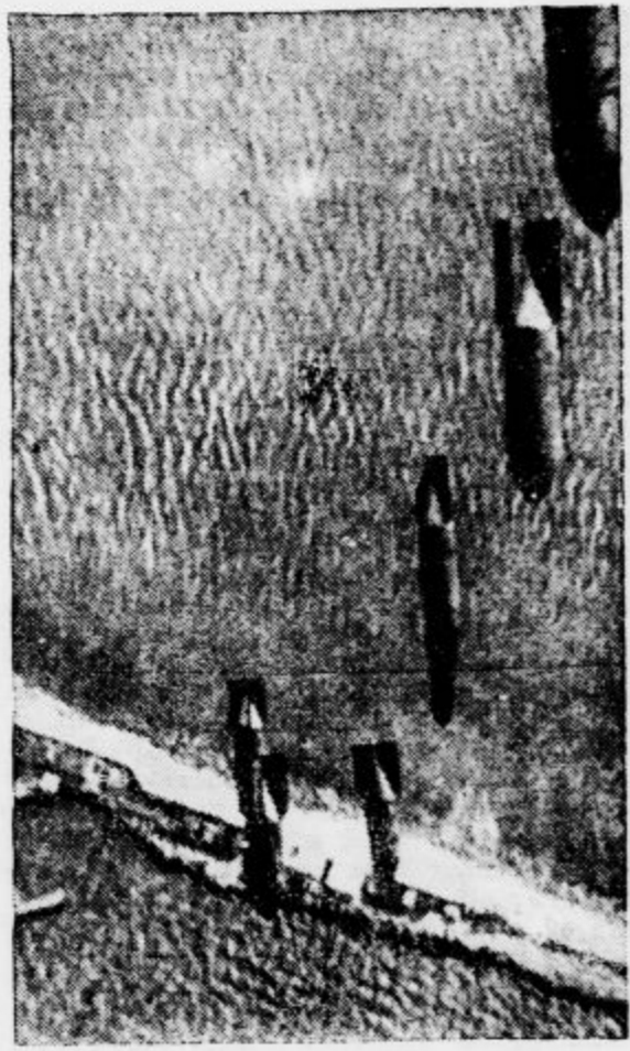
na angleško pristaniško mesto Portland