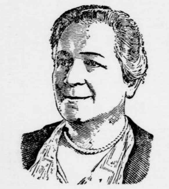
Ga. Olga Knipper-Cheva, prvakinja Hudoštvenga teatra v Moskvi je nedavno obhajala 70-letnico rojstva. Umetnica je vdova po pisatelju Antonu Čehovu