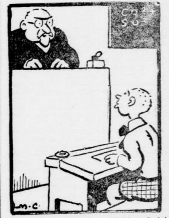
»Imenujte mi kakšne reči, ki vsebujejo škrob.« »Ovratnik in manšete, gospod profesor.« (»Dimanche Illustré«)