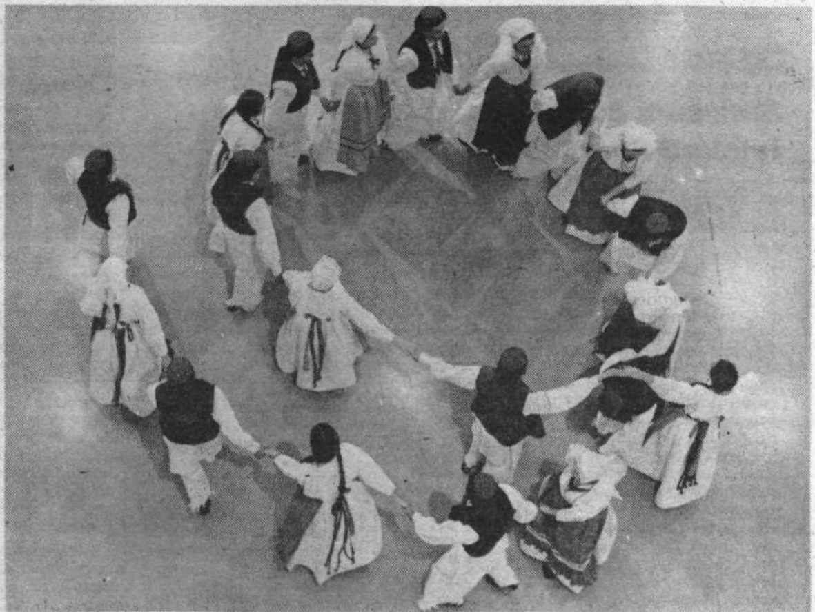
Maroltovci med enim od številnih nastopov