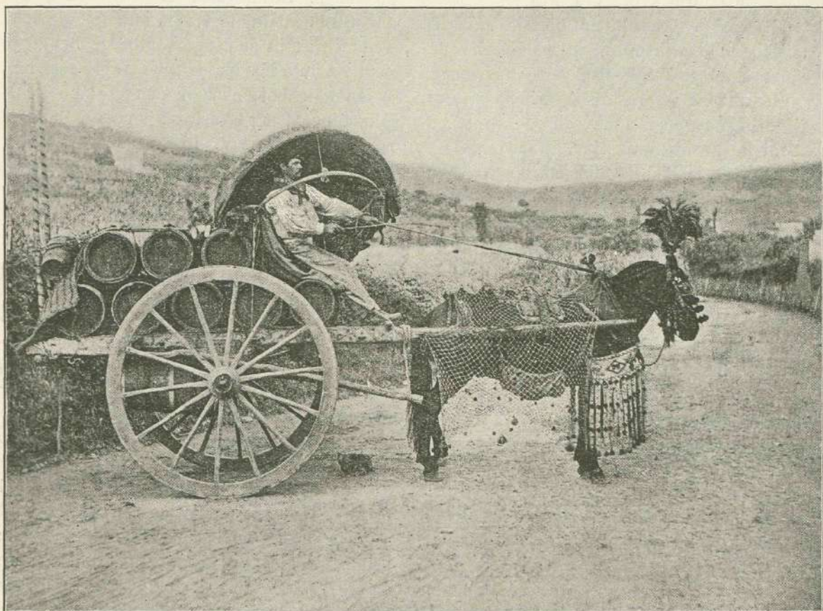
Voznik iz rimske okolice. (K spisu: „V albanskih gorah.“)

V mladosti je bil baje spreten gadolovec. Zato je imel neki še pri svojih petinpetdesetih do lazečine neko posebno veselje. Zagovarjati je znal ljudem, gade je lovil, jih sušil v dimniku, zdravil ljudi ž njimi in jih menda celo pekel in jedel. No pa tudi to poslednje se je le lagalo o njem.