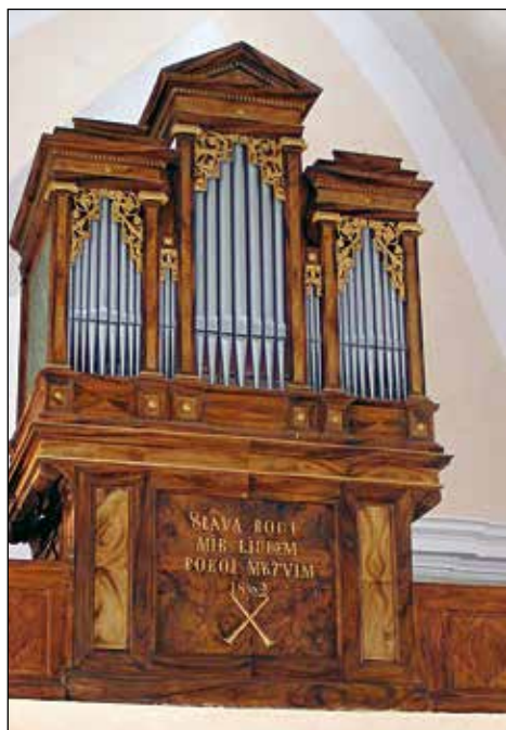
Orgle v cerkvi sv. Frančiška Ksaverja na pokopališču v Železnikih.

Ker so župnijsko cerkev sv. Antona Puščavnika med vojno požgali, nekaj časa v njej ni bilo bogoslužja. Ogenj je uničil tudi dragocene mehanske orgle iz leta 1842, delo znanega mojstra Rojca iz Radovljice. K sreči je med vojno ostala nepoškodovana cerkev sv. Frančiška Ksaverja na pokopališču, ki je nekaj časa služila za vse potrebe bogoslužja v župniji.