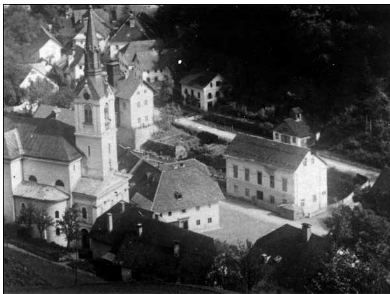
Pogled na Trnje v Železnikih z župnijsko cerkvijo, v sredini stavba mežnarije, v kateri je do požiga med drugo svetovno vojno stanovala družina Lotrič, desno prosvetni dom, zadaj stari gasilski dom na bajerju.

Usoda Fajglнове družine je bila kot mnogo drugih v Železnikih v rokah okupatorja. Najprej so leta