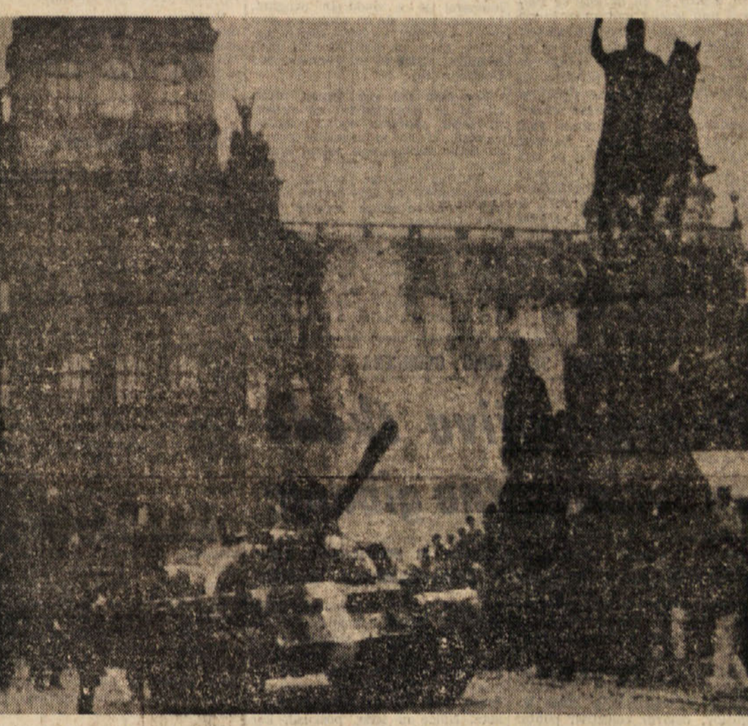
Slika, ki bo os'ala naprednim ljudem v žalostnem spominu