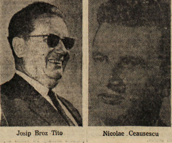
Josip Broz Tito