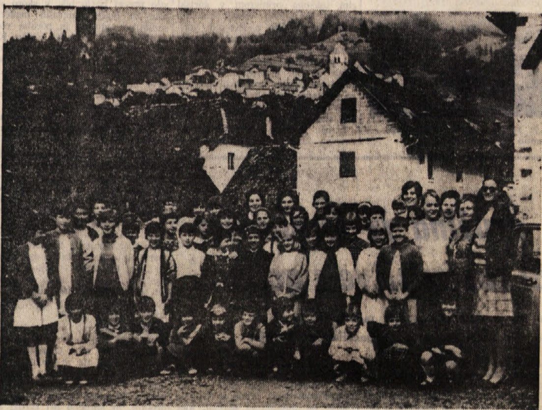
V gorski vasi v Karniji letujejo tudi letos v počitniški koloniji Vincencijeve konference iz Trsta slovenske otroke. Deklice iz te kolonije so nam poslale v objavo skupinsko sliko, zraven pa še pismo, naslovljeno na starše. Oboje prav radi objavljamo.