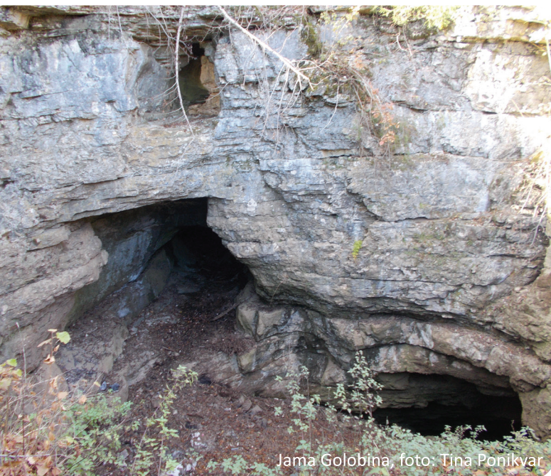
Jama Golobina

Nato smo se odpravili na Bloško polico, kjer smo želodčke ogreli s tradicionalno notranjsko jedjo iz rumene kolerabe, krompirja in fižola, imenovano »kavra«. Pot smo nadaljevali v Loško dolino, v vas Dane. Člani društva ljubiteljev Križne Jame so nam predstavili domačijo Kandare in življenje na loškem polju, kjer od rekordnih poplav leta 2010, loško polje vsako leto poplavlja. Vas Dane leži ob jami Golobina, do katere smo se odpeljali z lojtrnikom. Nad vožnjo smo bili navdušeni, saj se marsikdo od nas ni še nikoli vozil z njim.