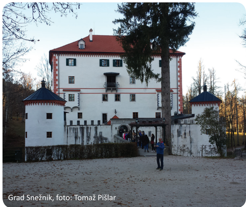
Grad Snežnik, foto: Tomaž Pišlar

okno v dnevnem prostoru princese Ane, ki ima pogled na vhod gradu), drugi pa po mrazu. Grad leži ob robu Javornikov, ki predstavljajo zahodno stran Loške doline.