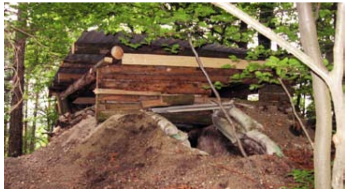
Skrivalnica Zemljanka, ki je zahtevala veliko truda.