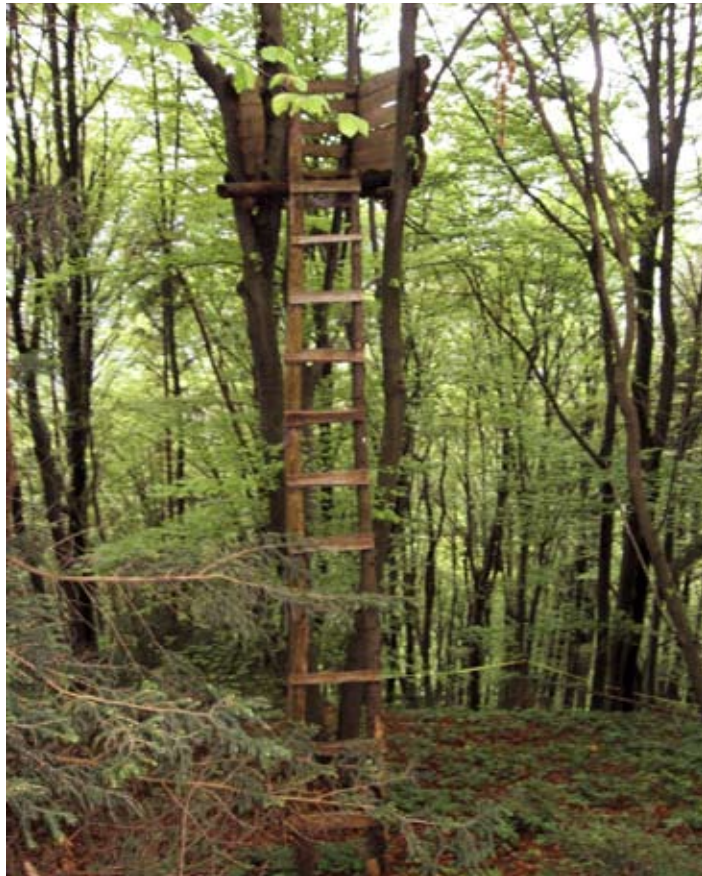
Opazovalnica, ki je podobna lovski. Le kje je nasprotnik?

taki naravi in okolici se človeku kar oko spočije. Ko se človek približa območju poligona, kjer potekajo taktične bitke, ga ob poti opozarjajo obveščevalne table, kje se nahaja. Sama okolica je za igro zelo primerna. Poligon leži prav na vršacu visokega hriba in prav na