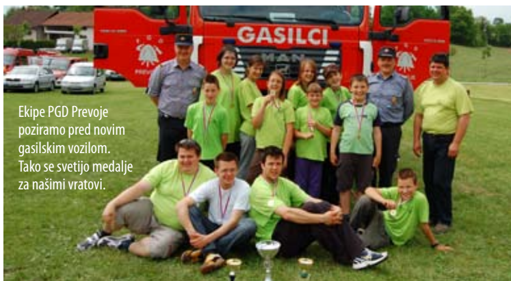
Ekipe PGD Prevoje poziramo pred novim gasilskim vozilom. Tako se svetijo medalje za našimi vratovi.