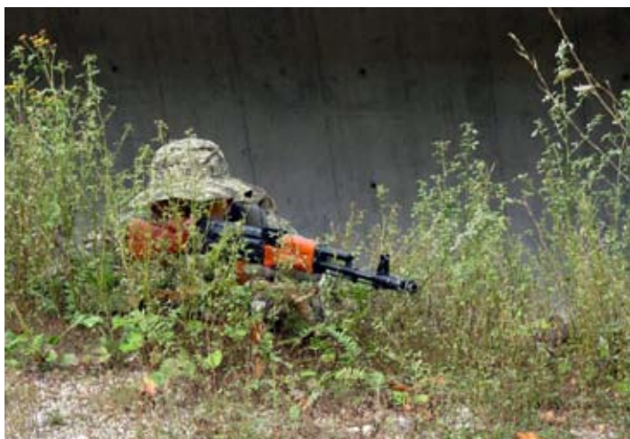
Zaveznik preži na nasprotnika.

V začetku klepeta je navrgel tole definicijo: »Airsoft je moderen rekreacijski šport, ki se je v zadnjih desetih letih izredno razširil po Sloveniji. V njem udeleženci poskušajo izločiti nasprotnika iz igre s tem, da jih ciljajo z razgradljivimi plastičnimi kroglicami (BB), ki jih izstreljujejo iz posebnih pušk in pištol za airsoft. Kroglice letijo od 5 pa tudi do 80 metrov