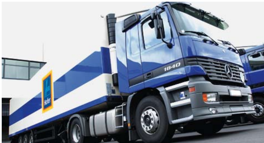
Hofer varuje okolje tudi z modernim voznim parkom

Hofer je na področju varovanja okolja ovrigel marsikateri kliše, saj je učinkovita izbira modernih tehnologij pri vodilnem diskontnem trgovcu visoko na lestvici prioritet. Zaradi zmanjševanja porabe goriva in količine škodljivih emisij je Hoferjev vozni park sestavljen le iz modernih in predvsem dobro izoliranih tovornjakov. Večina poslovalnic je ogrevanih z zemeljskim plinom oziroma ekstra lahkim kurilnim oljem brez žvepla. Zaradi uporabe okolju prijaznih goriv je poraba energije minimalna, s tem pa se zmanjša tudi količina škodljivih emisij.