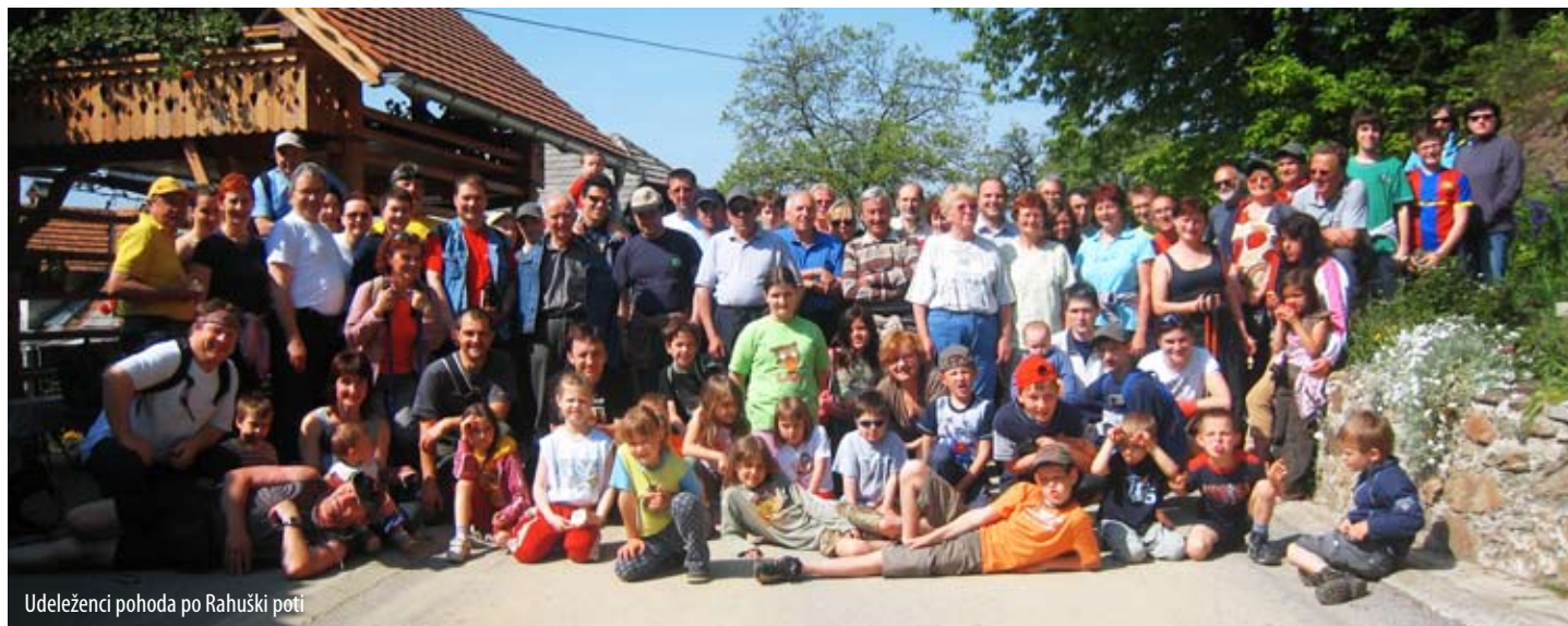
Udeleženci pohoda po Rahuški poti