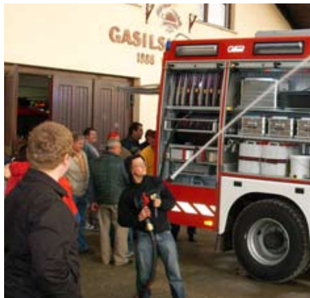
Pred gasilskim domom

Celotna investicija je bila ocenjena krepko prek 210.000 evrov. V to ceno so bili všteti