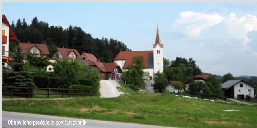
Obnovljeno pročelje in povišan zvonik

Že za to številko Rokovnjača sem o obnovi, ki je bila narejena v minulemu oz. letih, želel bolj obširno napisati, vendar je tema preobširna, zato bom do jeseni s pomočjo odgovornih pri obnovi pripravil daljši prispevek, kjer bom povedal bistvo in še kaj več.