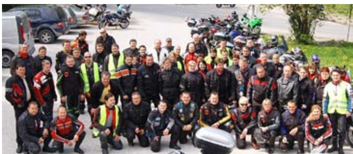
Skupinska slika na Mariji Reki

varnosti sebe in drugih, predvsem motoristov, ki smo poleg pešcev in kolesarjev najbolj ranljivi udeleženci v prometu.