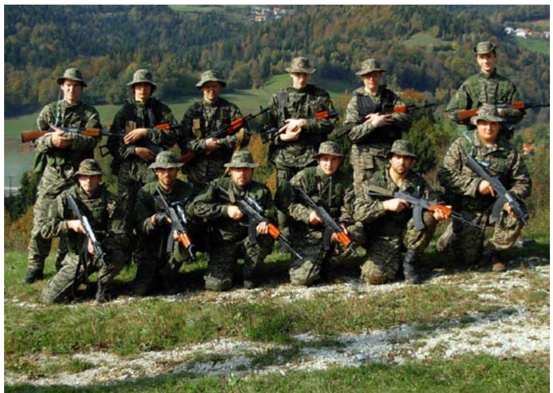
Videti so kot pravi vojaki.