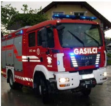
Težko pričakovani prihod domov

Okoli 18.00 smo se pripeljali pred gasilski dom, kjer nas je pričakala velika množica gasilcev in naših prijateljev. Pripravili so nam zares topel sprejem. Po strokovni predstavitvi vozila ter njegove opreme smo se z vozilom zapeljali po okoliških vaseh, da ga pokažemo tudi našim krajanom, ki jim je tudi namenjeno.