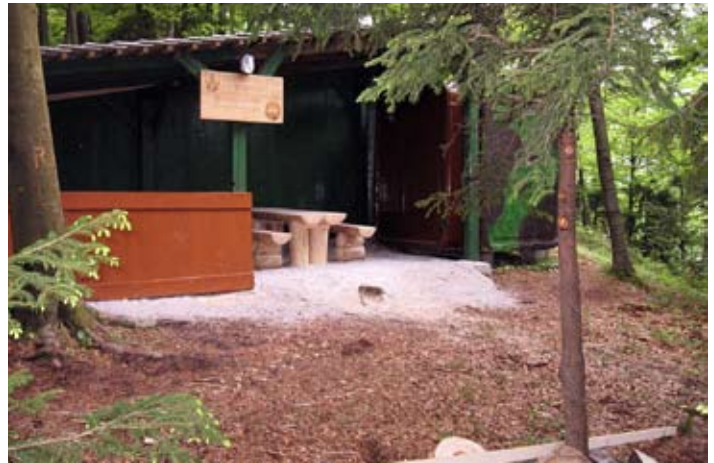
Večnamenska baza, zgrajena pred mesecem.

Po zapisu osnovnih informacij so me člani društva peljali na njihov 2 hektara velik poligon. Leži na odročnem kraju blizu vasi Podmilj. A je pot do tam lepo prevozna. Ob