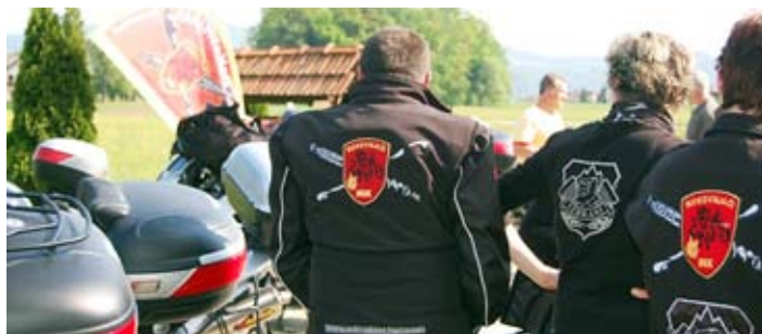
Motoristična sezona 2 – Klubske barve na zakuski po vožnji

Veselim se lepega vremena, ki nam ponuja varnejšo vožnjo. Za