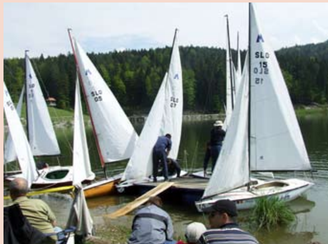
Morsko vzdušje v Lukovici

Jadrnica MINI 12 je rekreacijsko tekmovalni enosed in ima vse, kar imajo velike jadrnice. Tudi tokrat so za dobro počutje poskrbeli člani Turističnega društva Gradišče z gostinsko ponudbo. Poleg številnih tekmovalcev so se ob obali jezera zbrali številni ljubitelji narave, v lepem vremenu so uživali ob vodi in se sproščali v prelepem naravnem okolju.