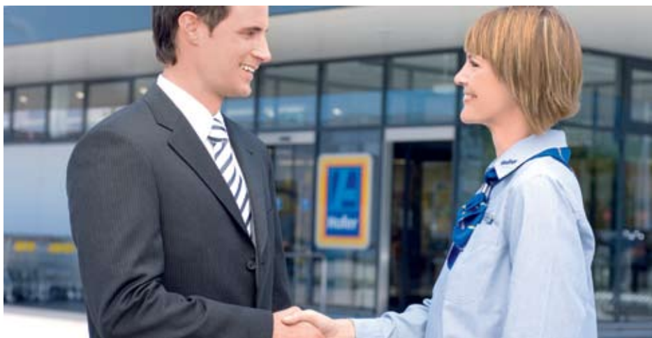
Hofer zaposluje le najboljše med najboljšimi

Tisti, ki delajo z vnamo, lahko pri Hoferju poklicno veliko dosežejo, pa naj imajo univerzitetno, srednješolsko ali osnovnošolsko izobrazbo. Za mnoge zato zaposlitev v Hoferju ne pomeni le službe, temveč tudi prvi korak na poti k uspešni karieri. Diskontni trgovec svojim zdaj že skoraj 700 sodelavcem