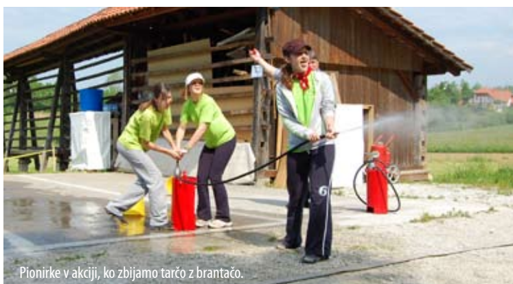
Pionirke v akciji, ko zbijamo tarče z brantačo.

Tako smo se v svojih kategorijah, v sklopu tekmovanja za GZ Lukovica, vse tri ekipe uvrstile na prva mesta. In se tako iskreno veselili svojega uspeha in uvrstitve naprej na regijsko tekmovanje. Po kar napornem tekmovanju, na katerega smo se pripeljali z novim gasilskim vozilom, pa smo se okrepčali še s pico in sokom ter sklenili, da bomo še pridno trenirali in nabirali kondicijo za nadaljnja tekmovanja.