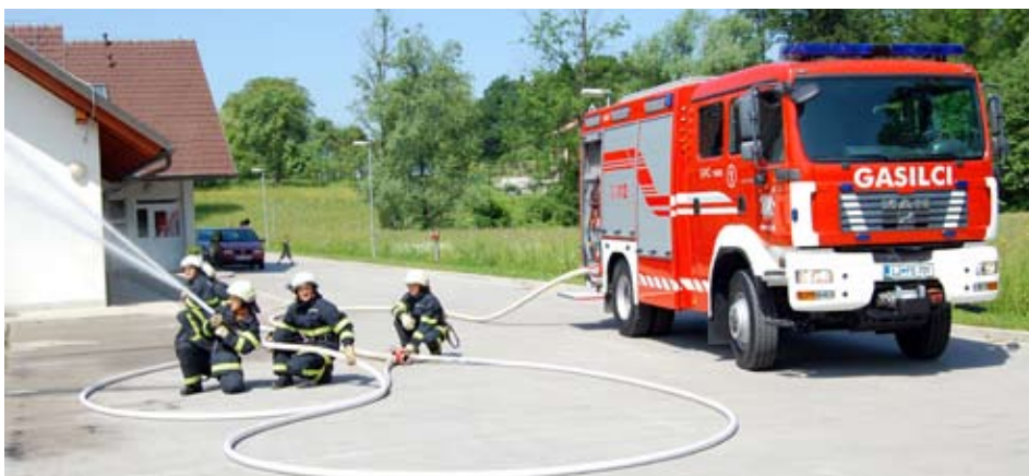
Prevojski gasilci pri vaji z novim vozilom

Na koncu naj omenim, da je vozilo opremljeno po predpisih gasilske zveze Slovenije, saj v nasprotnem primeru vozila ni mogoče registrirati. Vozilo GVC 16/25 PGD Prevoje tako ustreza vsem predpisom, ki jih predpisuje GZ Slovenije.