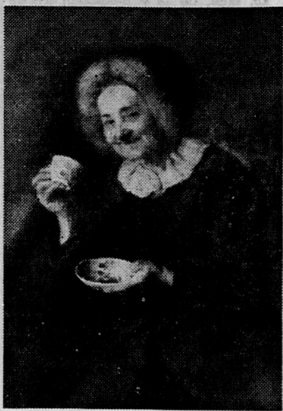
Kobilca Ivana (1861—1926): »Kofetarica«

Jasno pa je, da danes našim narodom, ki so v času narodnoosvobodilne borbe, v času obnove in v izgradnji, pokazali tako življenjsko silo, ne moremo pokazati naše likovne tvornosti v površni in nekvadratni izbiri. Tudi bratskim slovenskim narodom moramo pokazati v resnici izbrana dela naše umetnosti. Zato pa je bila presoja za razstavo zelo skrbna in ostra. Mnogo se je o tem razpravljalo tudi med našimi umetniškimi krogi. Toda mislim, da so že za nami časi, ko se je častil ozki in tesnoprni individualizem in da moramo tudi umetnostna vprašanja gledati v luči skupnosti in v zidika celotnega našega umetnostnega življenja. Ljudje, ki so dali naši razstavi lice, kakršno ima danes, so gotovo imeli pred očmi celoto našega umetnostnega ustvarjanja. Gotovo pa je tudi, da se je naš pogled na umetnost v zadnjem času precej izpremenil. Mi ne verjamemo prav nič več v neomejeno in nikomur odgovorno umetnostno anarhijo. Za vedno so minili časi, da je nekdo ustvarjal to, kar se mu je ljubilo, in da je namerstvo človeka upodobil pojem o človeku ter da je vse to označil n. pr. kot »duhovno« umetnost. Svobodna umetnost je umetnost svobodnega človeka, polna zdravja in ljubezni do žive resničnosti, ki pa je resničnost vsega naroda. Če bi govorili o umetnosti povsem preprosto in bi dejali, da je naloga umetnosti tudi ta, da dviga in gradi okus našim ljudskim množicam, potem je jasno, da je bila n. pr. zabuda ekspresionističnih pozikanov in podobnih modernizmov na razstavi skrbna na najmanjšo mero,