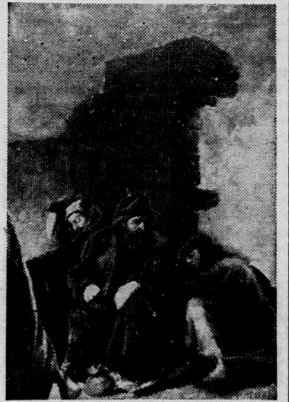
Jakšić Djura (1832—1878): »Karaul«

ljenja naroda, njegovo zgodovino. Zgodovino se poslužuje realizma, vendar je to že močno prežet s svobodnejšim, slikovitim načinom obdelave predmeta. Ta umetnost je na razstavi zastopana z lepimi podobami (Šubica, Krstić, Mašić, Kobilca). Portreti so že psihološko krepko utemeljeni in so ali globoko zamišljeni ali pa se obračajo h gledalcu s prijaznimi, prikupljivimi očmi. Veliko je slikarsko znanje teh umetnikov, ki v asfaltnih tonih skušajo razrešiti večno uganko človeškega obraza, izraza in telesa. Nekatje na robu glav, ob laseh ali v krajini pa že rahlo trepetajo svetlobni soj, ki se dokončno sprosti šele v impresionizmu. Dobo prehoda k impresionizmu zastopata genialna Hrvata Rajjić in Kraljević. Njuni portreti, grajeni v virtuozni tehniki volnuna in široke ploskve nam čudovito zgovorno pripovedujejo o notranjem življenju upodobljenec (prim. Račić: »Avtoportret«). Nato se razstavi prostor razsvetli. Tu visi naš dobri prijatelj Ivan Grohar s svojo »Loko v snegu«, »Pomladje«, »Stara Loko«, dalje Jama s »Kolomc«, »Krajinoc«, Jakopič z »Loko v snegu«, z lepimi