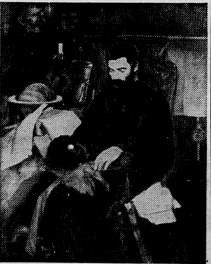
Krstić Djordje (1851—1907): »Anatom«

Razstava, ki zavzema prostore v prvem nadstropju Narodne galerije, je urejena tako, da sledimo razvojni umetnostni tvornosti od začetka 19.