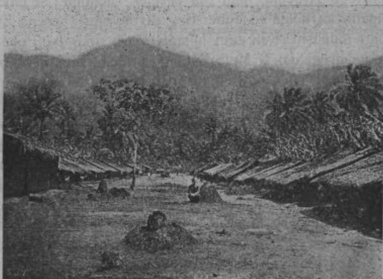
Ves v Kamerumi, v deželi Afrike.

Siromaško ljudstvo, mislo sem si, ne spoznavši tistoga, ki vse ravna i vodi, nikaj ne znajoč od tvojega Boga i njegovoga Sina, našega Rešenika i Zveličara, v noči nevere i šatringe vmarjaš lastno deco z comprniškov