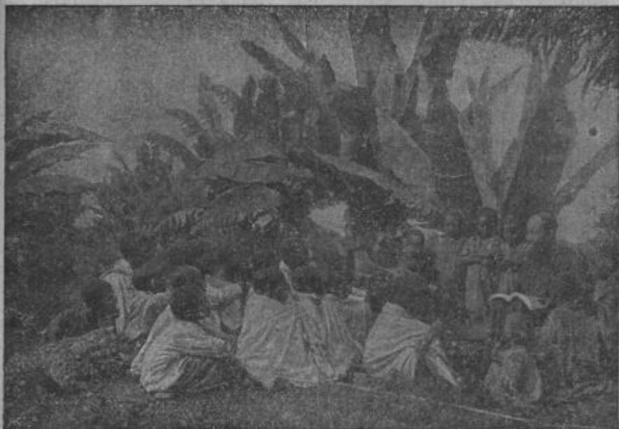
Afrikanski misijonar vči katekizem pod milim nebom.

i posebno med afrikanskimi siromaki je pa to, ka so naši siromaki v dūši bogati i v veri tolažbo lahko najdejo, siromaki Afrike so pa poganje i vūra svetlosti ne bo za nje prle bila, kak kda glāsitelje evangelija k njim pridejo. Če v svetlobi večnosti gledamo to reč, od pravoga siromaštva samo tam smemo gučati, kje prava, nadnaravna (višenaturna) vrednost menjka. Pri nas doma si samo tisti pogūbi dūšo, ki si jo šče, v Afriki si jo pa siromaški pogan zato pogūbi, ka ne pozna evangelija.