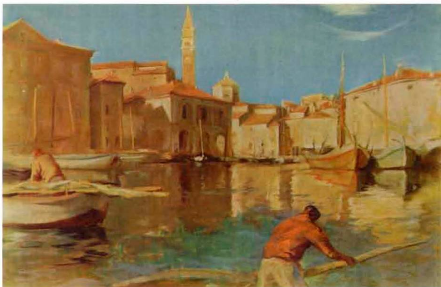
Božidar Jakac: Piran, 1947.

razume telo, ki zastopa interese in predstavlja nacionalno manjšino na področju uradne rabe jezika, izobraževanja, informiranja v jeziku nacionalne manjšine in kulture, sodeluje v procesu odločevanja ali odloča o vprašanih s teh področij ter ustanavlja