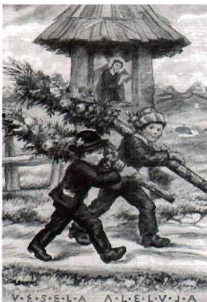
Maksim Gaspari Vesela Aleluja

Razvlečeno testo, pripravljeno po receptu za vlečno testo z začetka priloge, ki mu porežemo debele robove, namažemo z nadevom; če je nadev bolj redek, ga potresemo še z drobtinami ali zdrobom in zvijemo v klobaso. Zvitek prevalemo na ožet, z drobtinami potresen prt, povežemo z vrstico in počasi kuhamo v slanem kropu 1/2 ure. Kuhane štruklje pustimo na mizi nekaj minut, nato jih odvijemo, zrežemo na rezine in zabelimo s prepraženimi drobtinami. Slane skutne