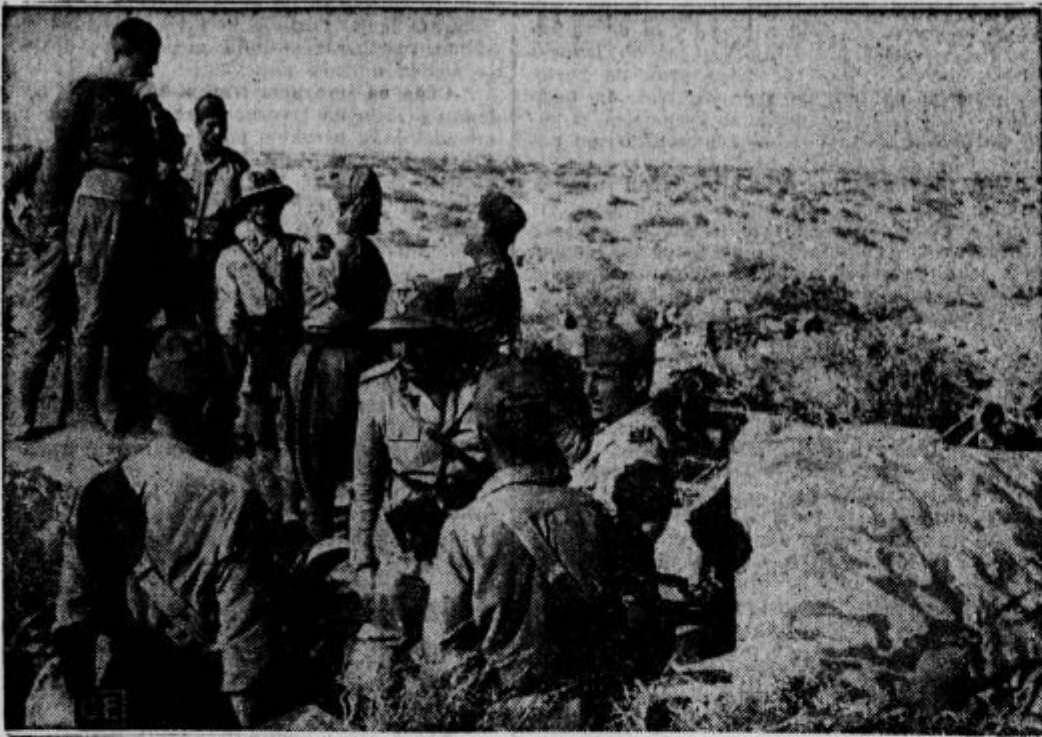
Razdeljevanje darov med vojake v prvih bojnih črtah v Severni Afriki