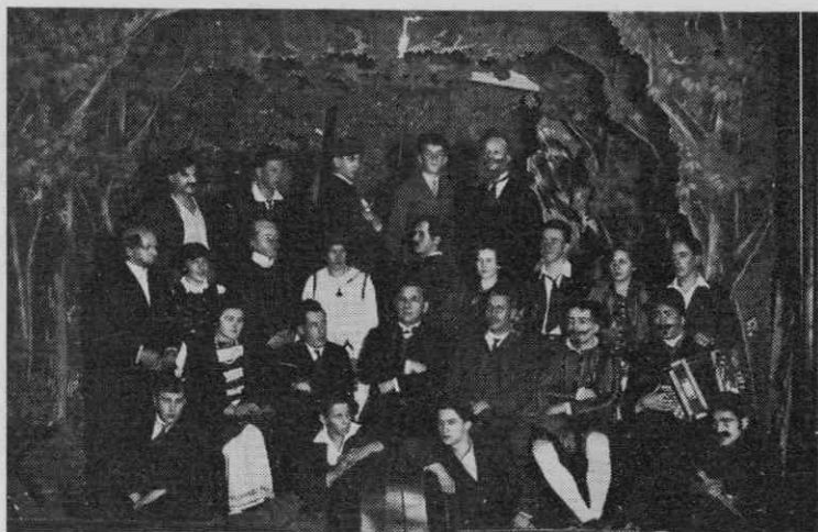
Igralci Linhartovega »Matička« na Državni realni gimnaziji v Kočevju, dne 3. februarja 1928