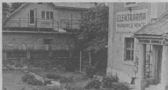
Hidroelektrarna ob Ljubljani na Fužinah je eden glavnih virov pridobivanja električne energije za potrebe Papirnice Vevce. Zato smo delavci tovarne na svojih zborih potrdili sanacijo oziroma rekonstrukcijo te elektrarne. CIRIL ZUPANČIČ