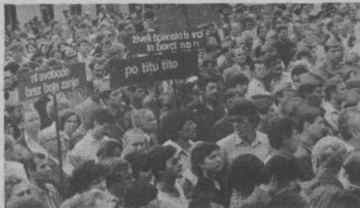
Tudi po Titu-Tito, Živeli španski borci in borci NOV, Ni svobode brez boja zanjo. Računajte na nas, Kolikor bomo delali, toliko bomo imeli itn. so bile parole, ki so izražale razpoloženje množice pred praslavo, med njo in po njej.