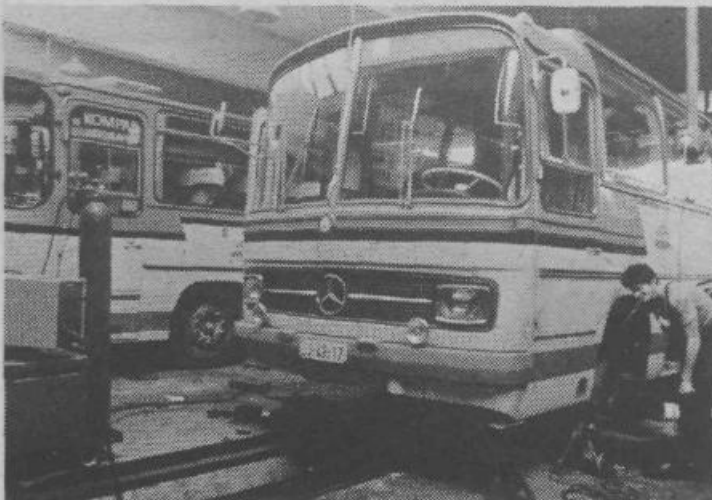
Prav v poletnih dneh so v tozdu Servo končali s prenovno tal in štirinajst kanalov v mehanični delavnici, izboljšali pa so tudi prezračevanje in gretje. Hkrati so že pripravili tudi projekt za novo poslopje, ki naj bi ga pričeli graditi prihodnje leto, v njem pa naj bi bili pralnica in karoserijska delavnica. V vse to so do sedaj vložili 8 milijonov dinarjev. Za dokončno uresničitev načrta pa bi jih potrebovali še okoli 140. Pri tej naložbi naj bi sodelovali vsi Sapovi tozdi.

Prijavi je treba priložiti evidenčni list z osnovnimi podatki o kandidatu, njegovem delu, izobrazbi in družbenopolitični aktivnosti. Vse informacije o šoli daje občinski svet ZS Ljubljana Moste-Polje, Proletarska 1-III, telefon 444-211.