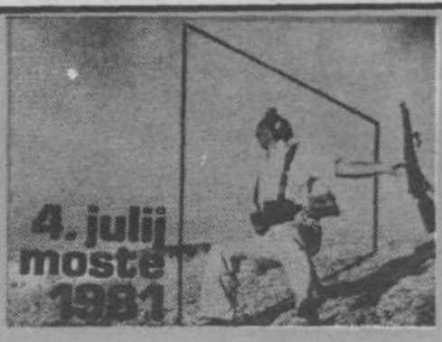
4. julij moste 1981

Ob praznovanju dneva borca v Ljubljani in ob novi delovni zmagi vas delovni ljudje in občani občine Ljubljana Moste-Polje