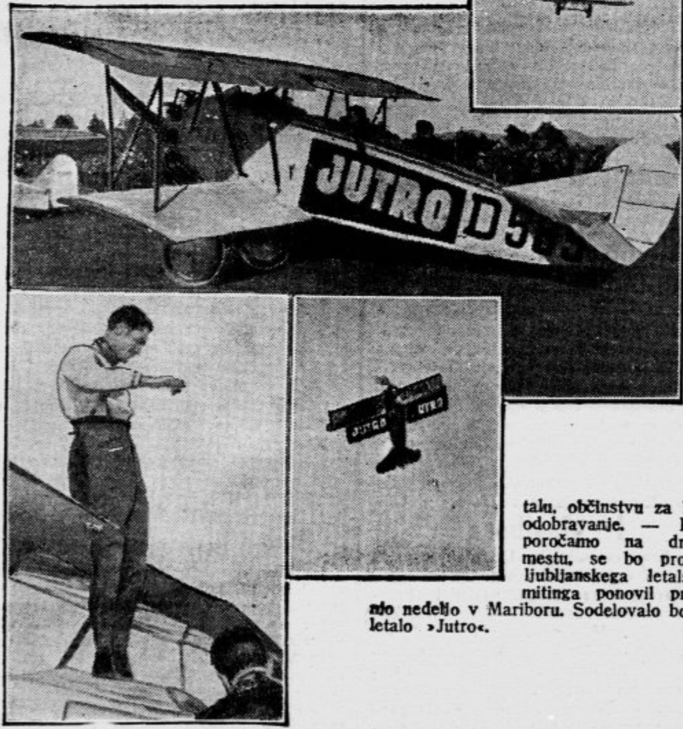
mo nedeljo v Mariboru. Sodelovalo bo tudi letalo »Jutro«.

talu, občinstvu za burno odobravanje. — Kakor poročamo na drugem mestu, se bo program ljubljanskega letalskega mitinga ponovil prihodnje nedeljo v Mariboru. Sodelovalo bo tudi letalo »Jutro«.