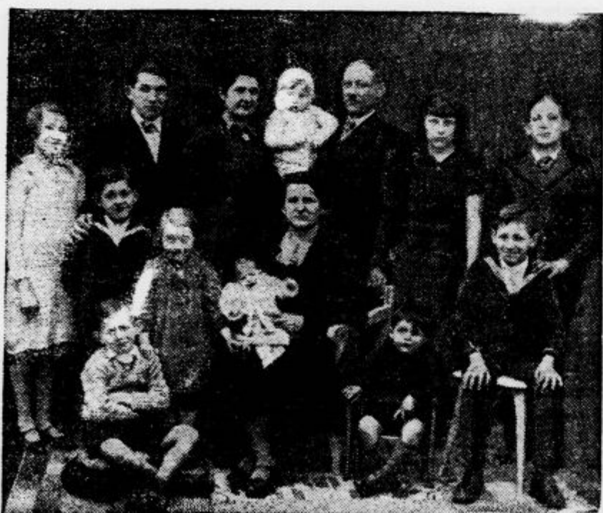
Očitek, da Francozi ne skrbje za naraščaj, pač ne more zadeti družine Haraut-Labrietove iz Commercyja, okrožje Meuse. Mati, ki je stara komaj 40 let, je dala življenje 13 otrokom, od katerih je samo eden umrl. Najmlajšemu je bil za krstnega botra sam državni prezident Francije g. Lebrun