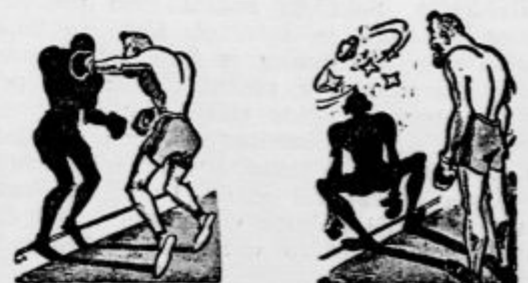
Boksanje s senco.