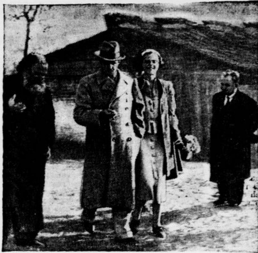
Albanski kralj Zogu s svojo nevesto v Draču