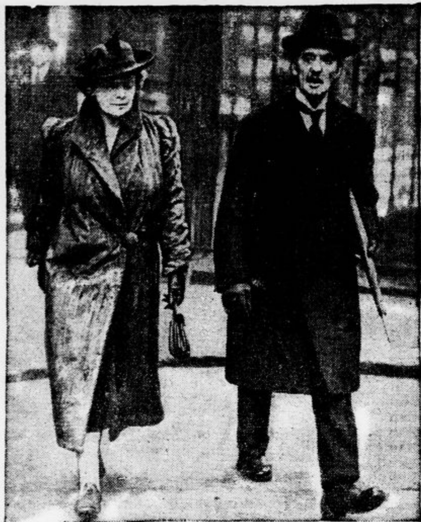
Angleški min. predsednik Chamberlain s soprogo