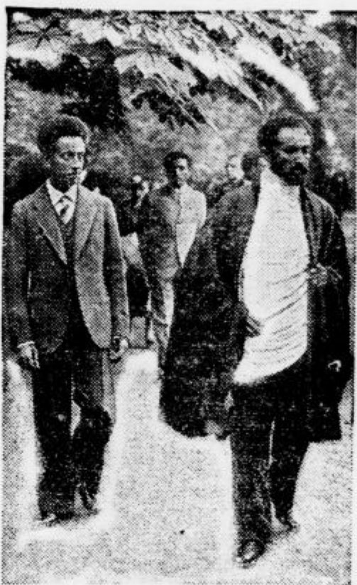
Abesinski cesar s svojim najstarejšim sinom v Angliji. Ker bo vprašanje likvidacije Abesinije v kratkem predloženo Društvu narodov v Zenevi, se svet z zanimanjem sprašuje, kakšna bo posledica usoda Haileja Selasija, ki živi že zdaj v zelo tesnih denarnih razmerah