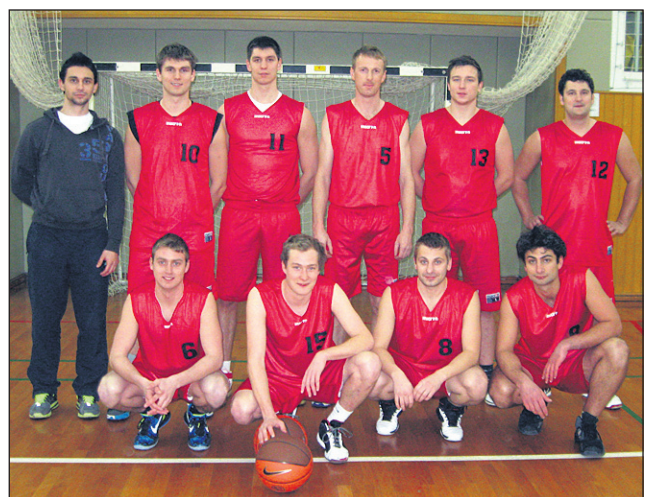
Ekipa iz Črešnjevca je tesno izgubila z vodilno ekipo NKBM.