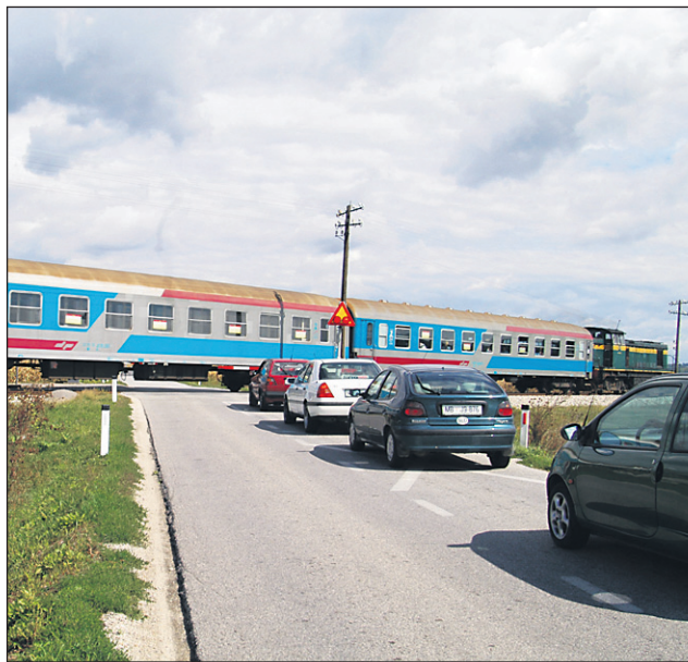
Za to, da so postavili zapornice čez zloglasni prehod ceste čez železnico v Cirkovcah, je od leta 2001 moralo ugasniti 11 človeških življenj.