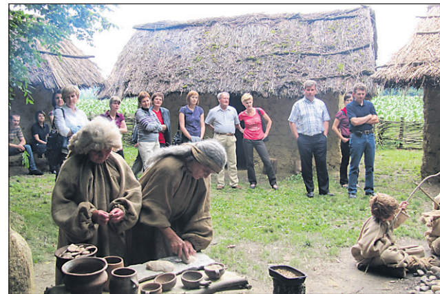
Člani TND Razkrižje prikazujejo življenje v prazgodovinski naselbini.