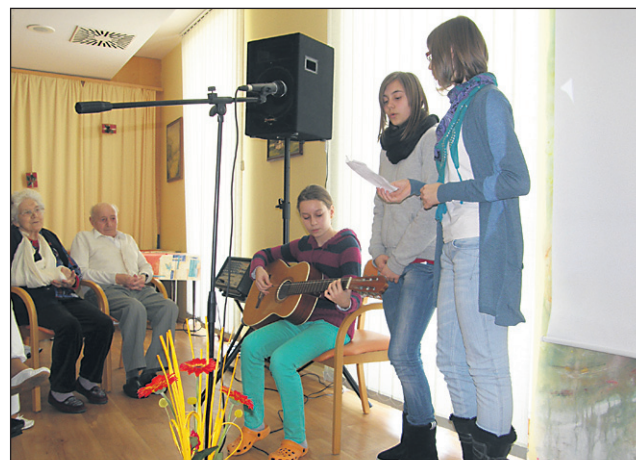
Na literarnem dopoldnevu so sodelovali tudi učenci OŠ Ormož.