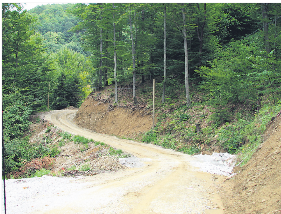
Podlehnška občina se bo prijavila na razpis MKO z dvema cestnima projektoma, a bodo dela (če bodo na razpisu uspešni) začeli šele v letu 2013 in 2014.

Na drugi razpis MKO pa smo prijavili modernizaciji dveh odsekov cest; gre za