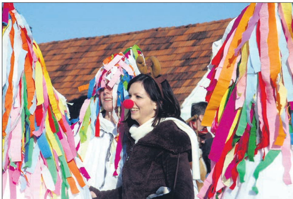
Med nagrajenimi skupinami 15. bukovskega fašenka je bila tudi izvirna skupina Nagušajnski piceki iz Nove vasi pri Markovcih.

Po končani povorki so se vsi nastopajoči v povorki zbrali na malici in zaključnem fašenskem plesu v kulturno-športni dvorani Bukovci, kjer so razglasili najboljše skupine. Po dogovoru tudi letos domačih karnevalskih skupin niso ocenjevali in nagrajevali, tako pa so prvo mesto prisodili skupi-