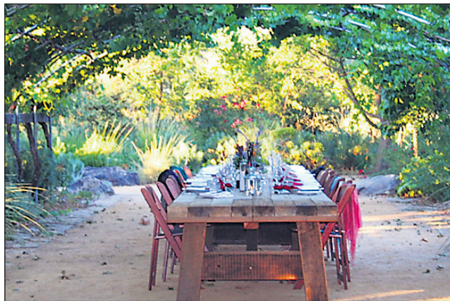
Nova uredba natančno navaja enološke tehnike in snovi, ki so v ekoloških vinih dovoljene.