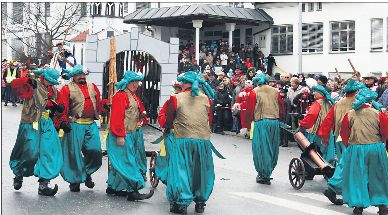
Letošnja prva nagrada za najbolj domiselno karnevalsko skupino na videmskem fašenk je pripadla Turkom iz KTD Soviče – Dravci.

Pisana povorka je v ponedeljek popoldne (kot že nekaj prejšnjih let) krenila od mosta v Šturmovcih do prizorišča pred osnovno šolo, kjer so se skupine, vsaka s svojim programom, predstavile občinstvu. Etnografski del povorke so sestavljale skupine oračev, korantov, pokačev, rus, značilni haloški