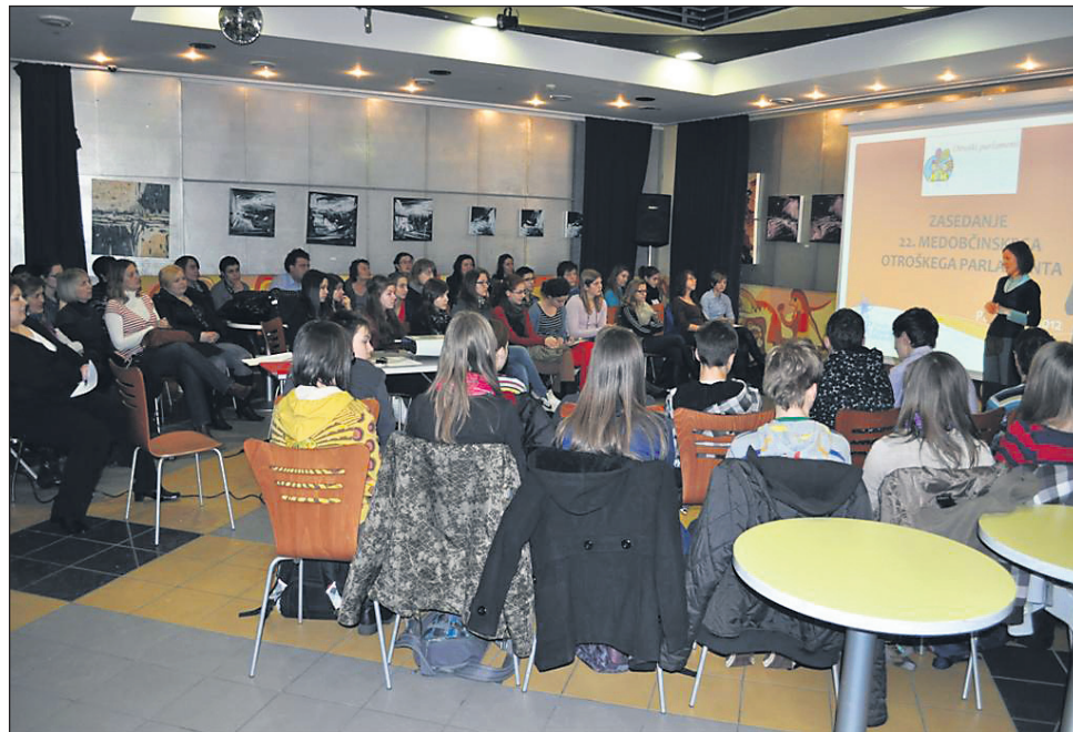
Šolarji so se na otroškem parlamentu odlično odrezali.