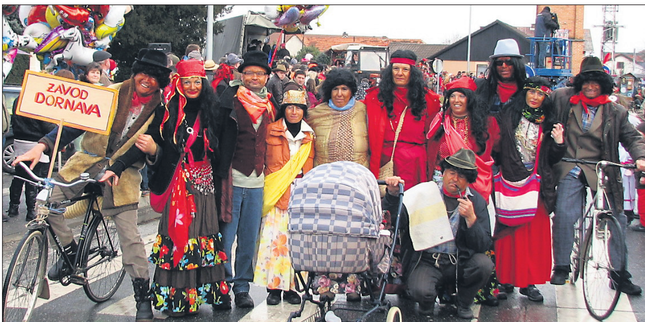
TED in ED dornavski cigani so na fašenski povorki imeli konkurenco, ki je verjetno niso pričakovali: cigane iz Zavoda (na posnetku).

Sicer pa se je letos dornavskega fašenka udeležilo skupaj kar 27 skupin, v katerih je nastopilo okoli 1100 maškar. Na začetku dolge povorke je pihala dornavska pihalna godba v uniformah križarskega