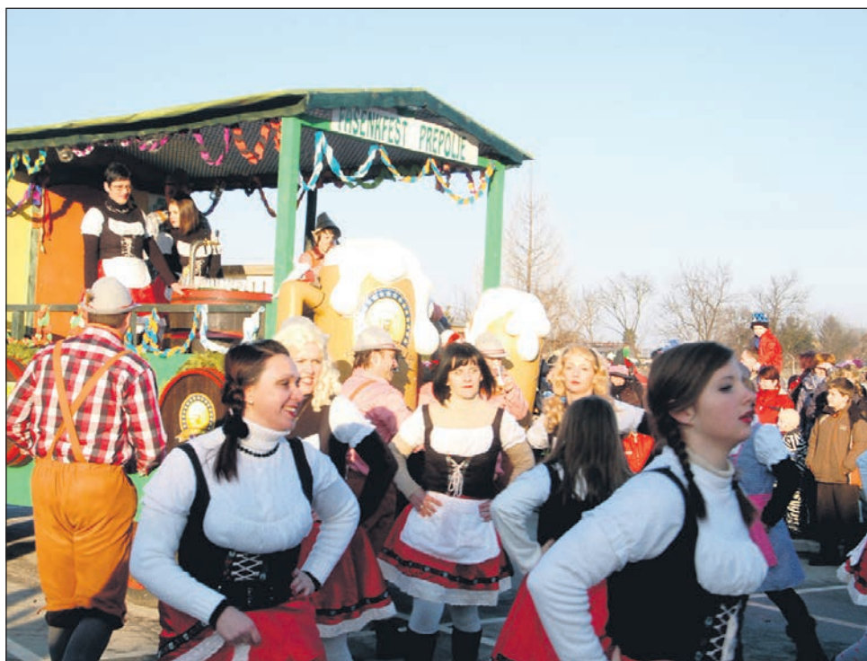
V karnevalskem delu cirkovške povorke je prvo nagrado prejela skupina Oktoberfest iz Prepolj.