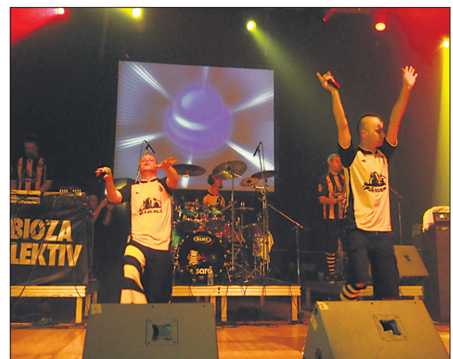
V soboto je dvorana Campus pokala po šivih. Dubioza kolektiv je privabil mnogo mladih tudi iz drugih krajev Slovenije, ki so se na ptujsko pustovanje pripeljali z avtobusi.