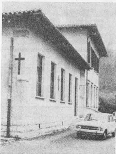
V tem šolskem posloju se opravlja tudi služba božja za ves Dol

To je na kratko zadnja zgodovina teh vasic, ki tvorijo župnijo Jamlje-Dol in se raztezajo od Sabličev nad Moščenicami do Čukišča ob razpotju za Opatje selo. Župnija je dolga kakih 12 km, verjetno najdaljša v goriški škofiji. Dejansko pa ločena v dve polovici, v Jamlje s svojo cerkvijo in v Dol s svojim bogoslužnim prostorom, posvečenim brezmadežnemu Srcu Marijinemu. Zato sta ob nedeljah dve maši, ena v Dolu, druga v Jamljah. To je razumljivo tako z avtorja različne preteklosti kot zaradi razsežnosti.