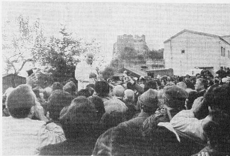
Sv. oče Janez Pavel II. med potresenci v torek 25. novembra

Obenem pozivamo vse naročnike, ki svoje obveznosti še niso izpolnili, da naročnino nemudoma poravnajo. S svojo brezbriznostjo prispevajo k težkemu položaju lista ob koncu leta. Če bi bili vsi storili svojo dolžnost, bi nam teh vrstic ne bilo treba pisati in finančni položaj lista bi bil zadovoljiv.