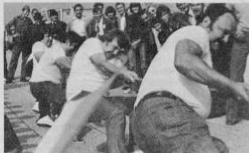
Vlečenje vrvi — najtežja in najmočnejša je bila ekipa Panonije