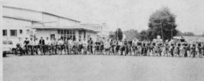
Udeleženci Trim akcije tik pred „startom“

Trim akcije so se udeležili delavci perutnarskih farm Kidričevo, Seta, Trnovci, Breg ter Valilnice. Zbralo se jih je okoli 40, kar je glede na število zaposlenih zadovoljiv odziv. Zanimivo je predvsem to, da so se