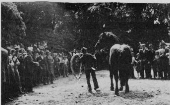
Najboljše krave so prejele zvonce, najboljši konji pa vence.

Na svečani seji delavskega sveta Obdravskega zavoda za veterinarstvo in živinorejo so sprejeli sklep, da podelijo priznanje vsem „pionirjem osemenjanja“, ki so pred 25 leti kot prvi začeli z osemenjanjem — med njimi tudi Cveto Doplihar.