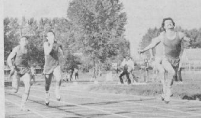
Cilj teka na 100 m: Prstec, Feguš in Zohar (od desne)

Zenske: 100 metrov: Ines Ryšlavy (Zg) 12,8; Renata Babič