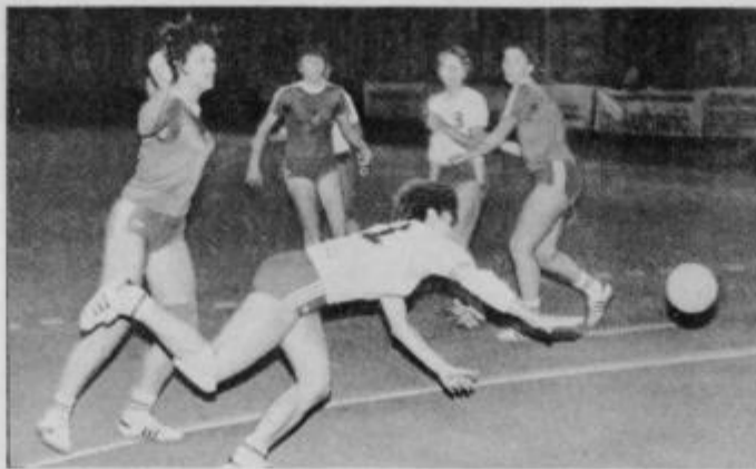
Prekršek nad Havlasovo in Černejeva je uspešno izvedla kazenski strel

V drugem delu smo ponovno gledali borbeno igro. Domače igralke so si priigrale tri zadetke prednosti, vendar je ta hitro splahnela na samo zadetek. Blizal se je konec srečanja in negotovost o izidu je dala igri še dodatno mikavnost. Z dvema zaporednima zadetkoma Halužanove si je Drava zagotovila zmago in prvi dve točki v severni skupini druge lige. V domači ekipi so se izkazale vse igralke, zlasti pa sta ugajali odlična strelka Mumlekova in vratarka Sitzenfrajeva. Pri gostjih je bila najboljša Mršnikova. Še