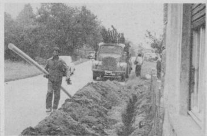
V Trgovišču je izkopavanje jarkov precej težavno. Na nekaterih mestih je potrebno kopati s krampi in lopatami.

V izkopani jarek polagajo kabel za krajevno telefonsko omrežje, medkrajevni koaksialni kabel (financira ga poštna skupnost Slovenije) in medkrajevni poštni kabel (investitor je PTT Maribor). Medkrajevni koaksialni kabel bi omogočal 3000 pogovorov v sekundi, prek poštnega