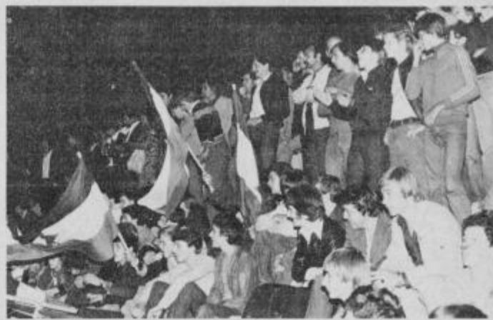
„DRAVA! DRAVA! Dajmo naše!“ Tako je v soboto odmevalo s polnih tribun, gledalci so se izkazali, prav tako igralke.