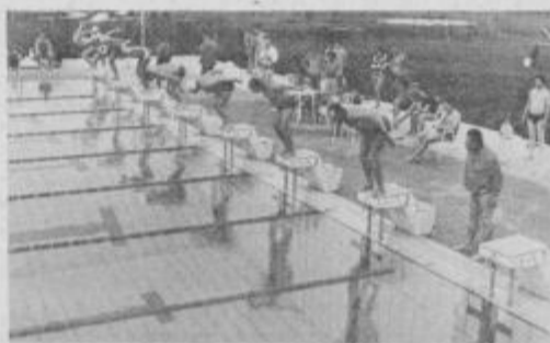
Milčniki iz organizacijskih enot UJV Maribor, so dokazali, da so tudi uspešni plavalci.