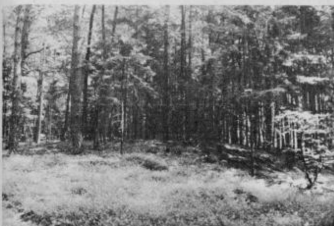
Ena od gomil v osrčju Velenika, ki sta ju prerasla čas in drevje.

Teško bi danes povedali odkod izvira ime gozda med Zg. Poljskavo, Leskovcem in obronki krajevne skupnosti Slovenska Bistrica. Krajani, ki živijo ob njem menijo, da ime tega gozda, Velenik izhaja iz davne preteklosti in v sebi skriva veliko kulturno zgodovinskih znamenitosti. Mnoge od njih so zrasle v majhne legende, o katerih starejši poznavalci tega gozda, še danes radi pripovedujejo svojim otrokom in znancom. Vse