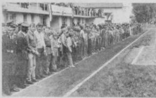
Pred začetkom tekmovanja na NK Drava v Ptujju je bil zbor vseh udeležencev.