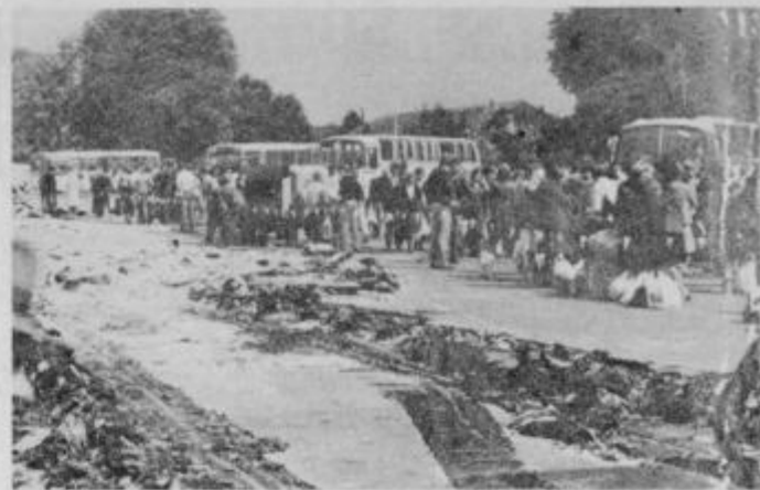
Pred položitvijo posebnega betona na peronih ptujske avtobusne postaje so morali odstraniti debelo plast že zgubane gline.