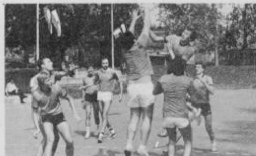
Tudi v rokometu je bila najboljša ekipa Panonije