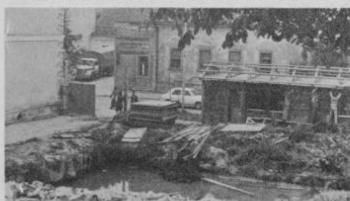
Ob zgradbi ormoškega Kmetijskega kombinata bo zrasel nov 18-stanovanski blok