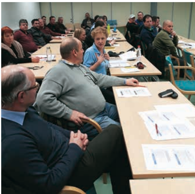
»Vroča debata« na temo nove gradbene zakonodaje

Prisotni podjetniki so menili, da zakonodaja posega v njihove že pridobljene pravice do opravljanja dejavnosti pridobljene z obrtnimi dovoljenji in v mnogih primerih tudi nekaj desetletnimi izkušnjami na posameznih področjih dela, jih dodatno časovno in finančno obremenjuje, kar je nekomu očitno v prid. Razšli smo se precej »razkurjeni«.