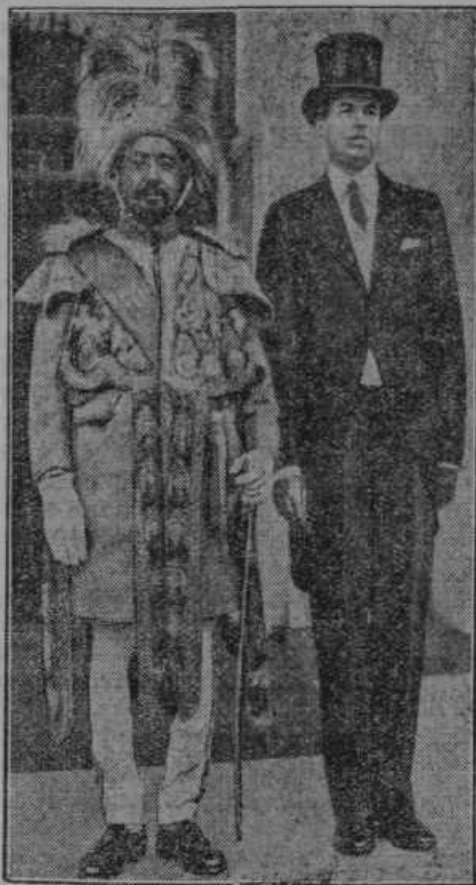
Abesinski princ prinaša v spremstvu pritočnika ameriškega, predsednika Rooseveltu pozdrave cesarja Abesinije (v vzhodni Afriki.)

ni ostala neprizadeta niti ena trgovina in so uničene tudi vse zaloge blaga. Nad 10.000 prebivalcev je izgubilo vse svoje imetje. Med prebivalstvom vlada silna žalost in potrto. Mnogi so izvršili samomor. Koliko človeških žrtev je zahtevala nesreča, se še ni dalo ugotoviti. Do sedaj pogrešajo okrog 100 ljudi.