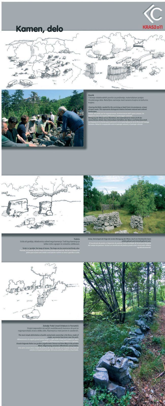
Slika 1: Razstavnno pano, kamen #04. Figure 1: Exhibition poster, stone #04.