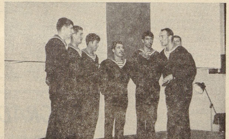
Naš pevski zbor na enem od številnih nastopov

Mornarski klub je skupno z organizacijo ZSM dal pobudo za vrsto zelo koristnih akcij, med drugimi tudi za ureditev zelenih površin okrog spominskega obelež-