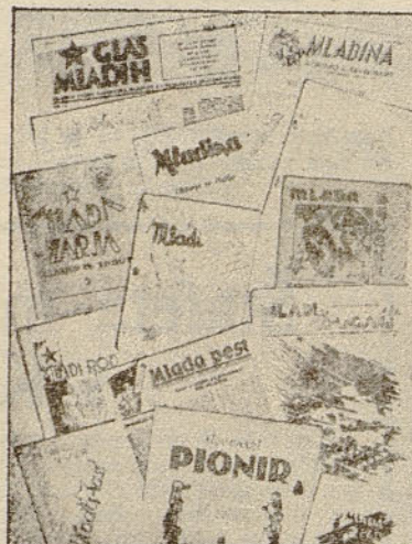
Naslovne strani pomembnejših mladinskih glasil

novinarjev in drugih. V njenem obsegu pa se pojavljajo tudi priloge, kot so Mlada pota, literarna priloga, Prizma kot priložnost za mlade, teoretična priloga kot prostor, namenjen širjenju marksistične kulture, ter Informacije AŽ kot informativna tribuna organizacij in organov ZSMS. Ob 25-letnici izhajanja jo je predsednik republike Josip Broz Tito odlikoval z Redom zaslug za narod s srebrnimi žarki za posebne zasluge in prispevke pri širjenju