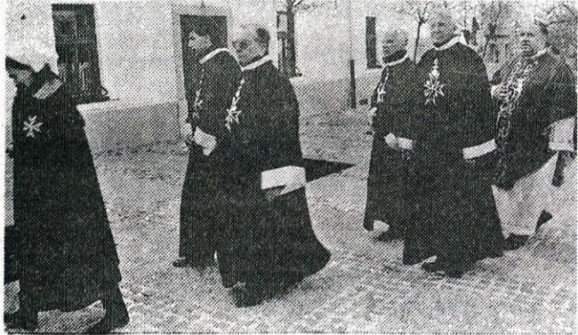
Slovesen spreved iz cerkve