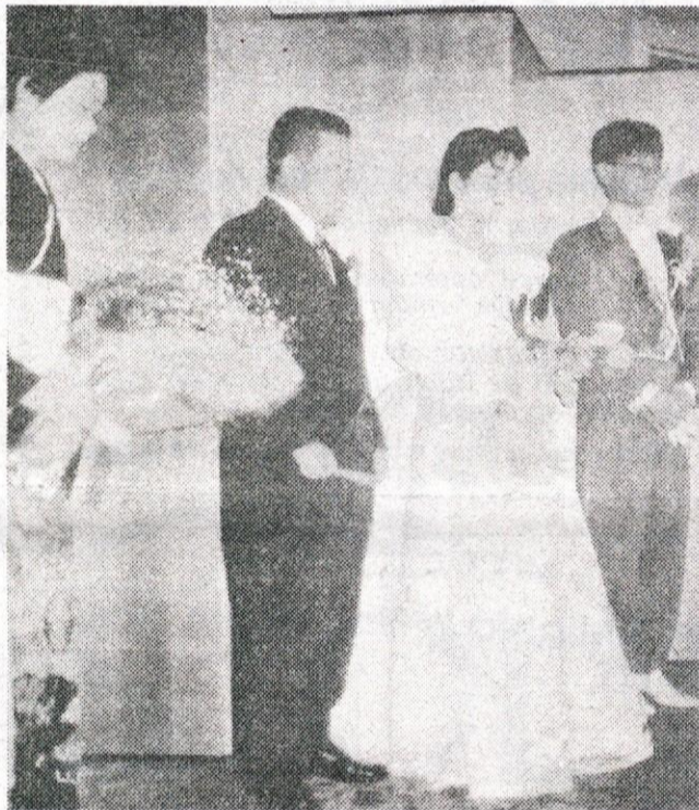
Mladoporočnica z nevestinimi starši med poročnim obredom.

Vesel božič in srečno ter uspešno novo leto 1995 vam želi