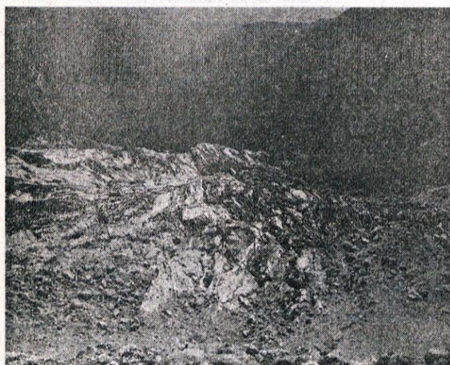
Mali podi.

V vzhodnem, zelo strmem delu grebena, ki se sredi Velikih podov vleče od Legarjev proti vzhodu in z juga omejuje krnico pod Štrucu, je Zleb, ki ima v sredi dve okni. Ta Zleb je skoraj dva raztežaja nad markirano potjo, samega okna se pa s poti ne vidi. Če ga hočemo videti, moramo priti prav pod njega. Most, pravzaprav okni, sta več kot 10 metrov nad gručem in če hočemo priti do njiju, moramo plezati. Odprtina, ki gleda na pode, je široka približno meter in visoka 3 do 4 metre. Ena od odprtini na zgornji strani je dolga približno 4 metre in ožja od metra, druga ima manj kot 3 metre