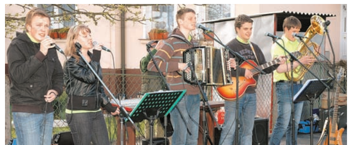
Mladi Podgorci so poskrbeli za prešerno razpoloženje.