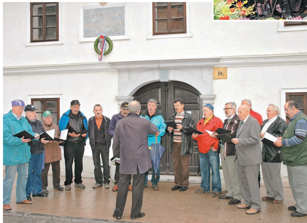
Na predvečer rojstnega dne Rudolfa Maistra so v ponedeljek, 28. marca, pred njegovo rojstno hišo na Štuni zadonele Maistrova pesem Završki fantje in druge, ki so jih zapeli pevci Moškega pevskega zbora DKD Solidarnost.

»Pregovor pravi, da prva lastovka še ne prinese pomladi. Drži, daje pa novo upanje in vliva optimizem. Nič nam ne bo podarjeno, za vse se bo potrebno truditi, a s sodelovanjem uspeh ne bo izostal. Strah nas je lahko samo strahu samega, ničesar drugega. Vsem dobitnikom priznanj gre zahvala za dosedanje delo v dobro lokalne skupnosti, obenem pa naj jim bodo spodbuda za naprej. Zahvaljujem se tudi vsem drugim, ki vsak dan delate v korist Občine Kamnik in ji želite dobro. Ob jutrišnjem prazniku vsem iskreno čestitam in želim tistega poguma in zanosu, ki ga je poosebljal naš veliki rojak general Rudolf Maister«, je slavnostni govor v Domu kulture Kamnik zaokrožil župan Marjan Šarec.