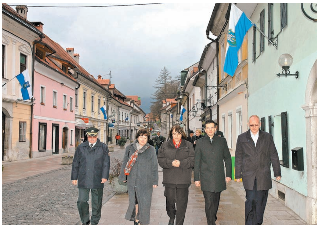
Po slovesnosti pred Maistrovim spomenikom so se zbrani z ministrico in gosti odpravili peš po starem mestnem jedru do rojstne hiše generala Maistra na Štuni.