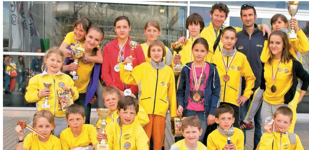
Najmlajši tekači KGT Papež s številnimi pokali na teku v Avstriji

V soboto, 2. aprila, ob 8. uri je bil start nad vasjo Mače pri Preddvoru (začetek pešpoti na