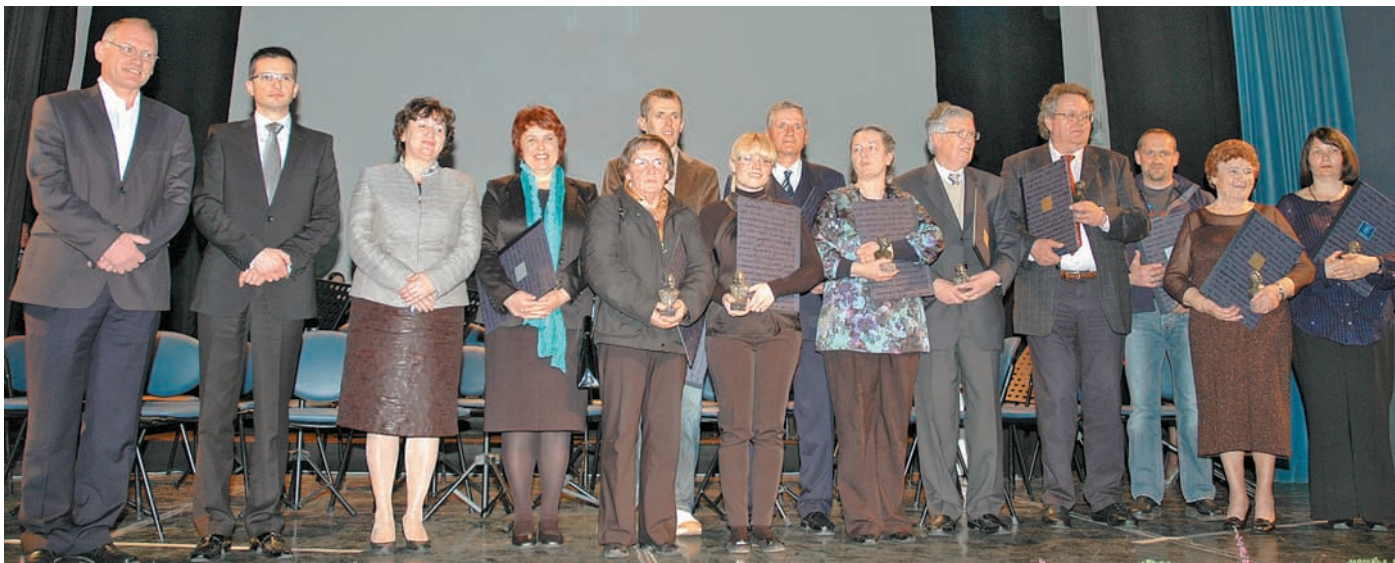
Prejemniki priznanj z županom in podžupanoma.