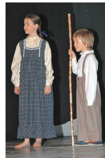
Mladi komendski folkloristi so ples pospremili še z uprizoritvijo igrice Izgubil se je bacek.