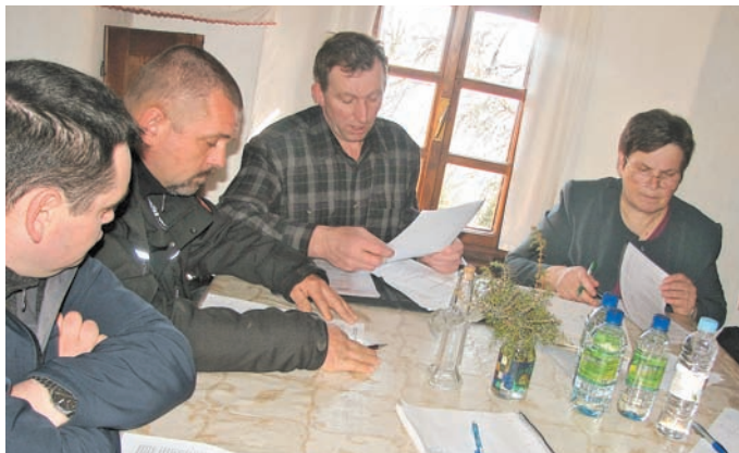
Delovno predsedstvo TD Gora sv. Miklavž.