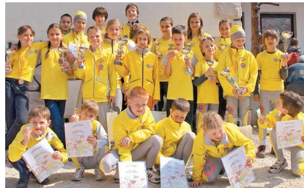
Skupinska fotografija zgoraj: Kar 14 najmlajših tekačev KGT Papež se je veselilo zasluženih pokalov.

Z današnjim tekom sem zelo zadovoljen. Vse je teklo kot namazano, vreme je bilo odlično. Moji zvesti pomočniki in matični klub mi vsako leto stojijo ob strani in mi pomagajo, tako da sem kljub funkciji organizatorja lahko tudi tekel. S svojo uvrstitvijo sem seveda zadovoljen. Vesel sem, da so tekači zadovoljni. Hvala vsem, ki ste mi pomagali, pa tudi sponzorjem, predvsem Calcitu d.o.o., ki je naš sponzor že vseh šestnajst let.