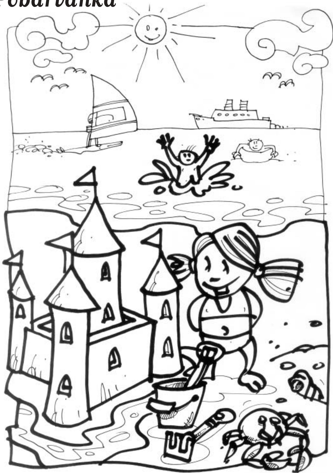
Nagrajenka pobarvanke iz prejšnje številke je Klara Jelenc, Dobruša 9.