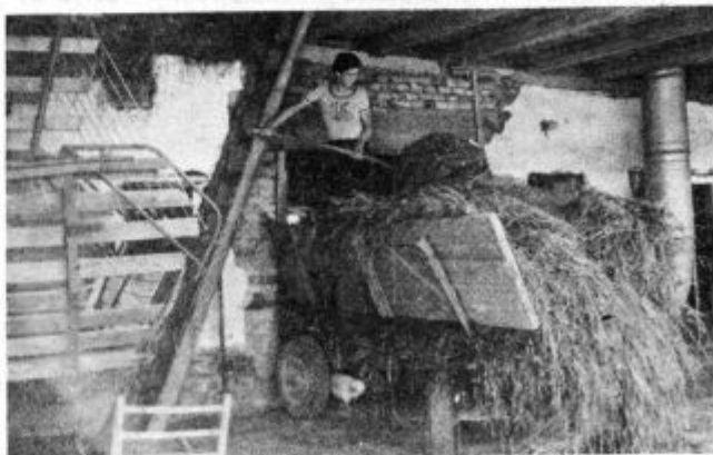
Najmlajši pri Družovčevih poprime za vsako delo