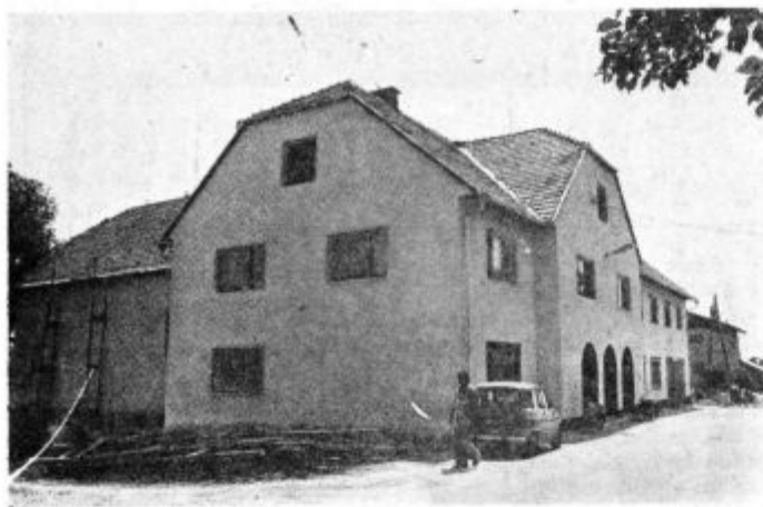
Obnovljen kulturni dom v Selcah