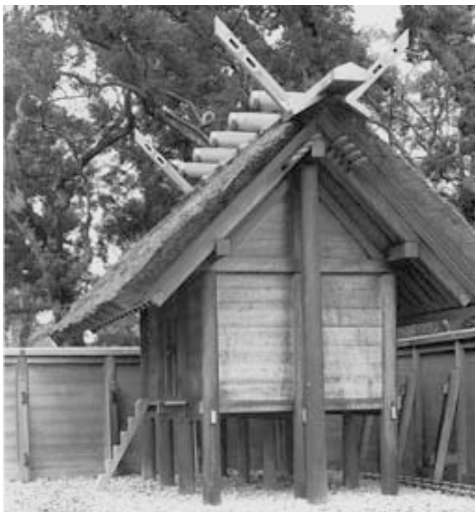
Slika 3: Odmik od terena in dodatni stebri, ki nosijo težo strehe. Distance from the ground and additional columns that bear the weight of the roof.