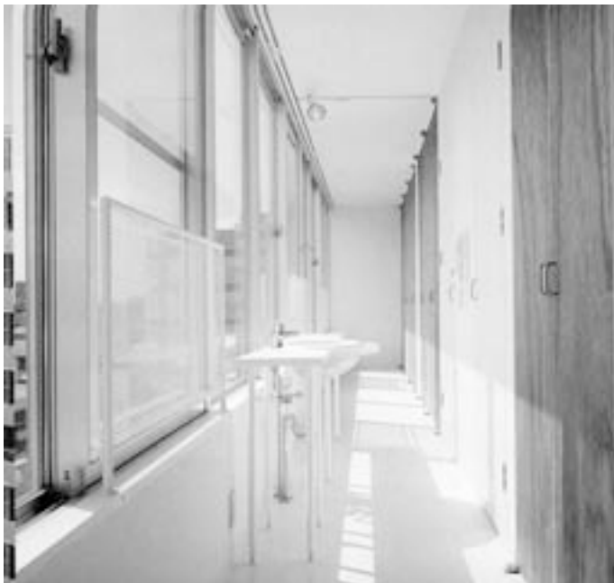
Slika 5: Za naše razmere skromna kvadratura. Duhovita rešitev z umivalnikom v "hodniku" in na fasadi, ki pa ne zagotavlja primerne zasebnosti. Kazuyo Sejima, Gifu, 2000. Modest surface area for our circumstances. The imaginative solution with the sink in the "hallway" and facade, which nevertheless doesn't guarantee adequate privacy. Kazuyo Sejima, Gifu, 2000.