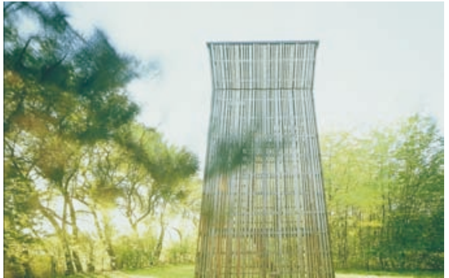
Sliki 4 in 5: Sodobno, minimalistično zasnovan arhitekturni objekt sredi parka, kjer naj bi otroci prosti čas preživljali v igri in zabavi. Postavitev v zelenje se približa izhodišču za vrtno uto, iz katere naj bi po svoji funkciji izhajala tudi bosanska divhana s kamerijo. [Marolt, 2006: 43] Modern, minimalist architectural layout of a building in a park, where children can spend their leisure time playing games and enjoying. The setting among greenery is close to the rationale of a garden hut, which is also the functional origin of the Bosnian divhana with kamera. [Marolt, 2006: 43] Ralph Erskine, stolp – "hišica" sredi parka v Køpenhagenu, 2000.