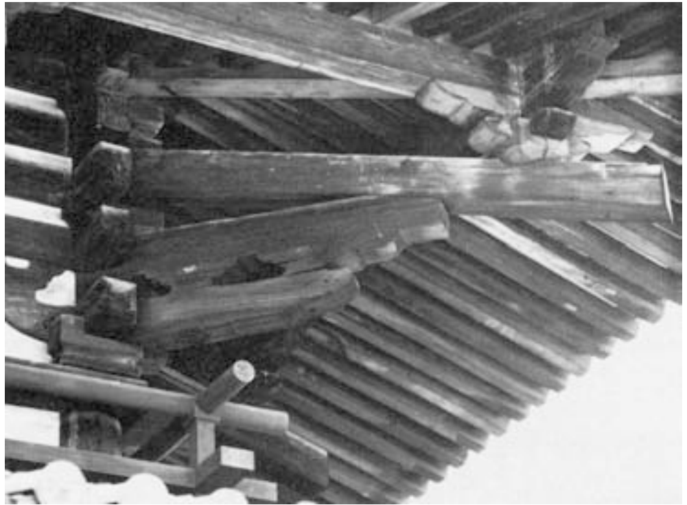
Sliki 1 in 2: Kadar gledamo pod "bogato okrašen", globok napušč japonske (tempeljske) arhitekture, bi lahko zmotno mislili, da gre za okraševanje. Princip "vzvoda" omogoča enakomernjšo razporeditev teže, statično ravnovesje v osnovnem pomenu besede. When we look under the "richly decorated", deep eaves of Japanese (temple) architecture, we could be deceived into thinking that it is mere decoration. The principle of the "lever" enables equal distribution of weights, static balance in the prime sense of the word. Vir: Zwerger, K., 1997: Wood and Wood Joints: Building Traditions of Europe and Japan. Birkhäuser, Basel, Berlin, Boston: 175 (sliki 376, 377).