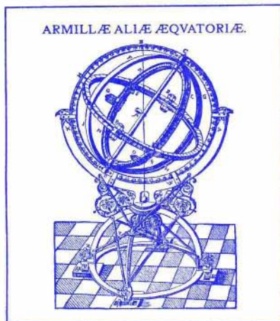
Slika 1. Kotomerni instrument, imenovan armilarna sfera, na Uraniborgu.

Brahe je v astronomsko prakso vpeljal še dodatne naprave (razne vizirje) za povečanje natančnosti usmerjanja instrumentov na svetila in priprave za odčitke na merilnih krogih. Tako je dosegel natančnost izmerjenih leg zvezd na okoli eno kotno minuto, česar tudi pozneje pri opazovanju s prostim očesom nihče ni izboljšal.