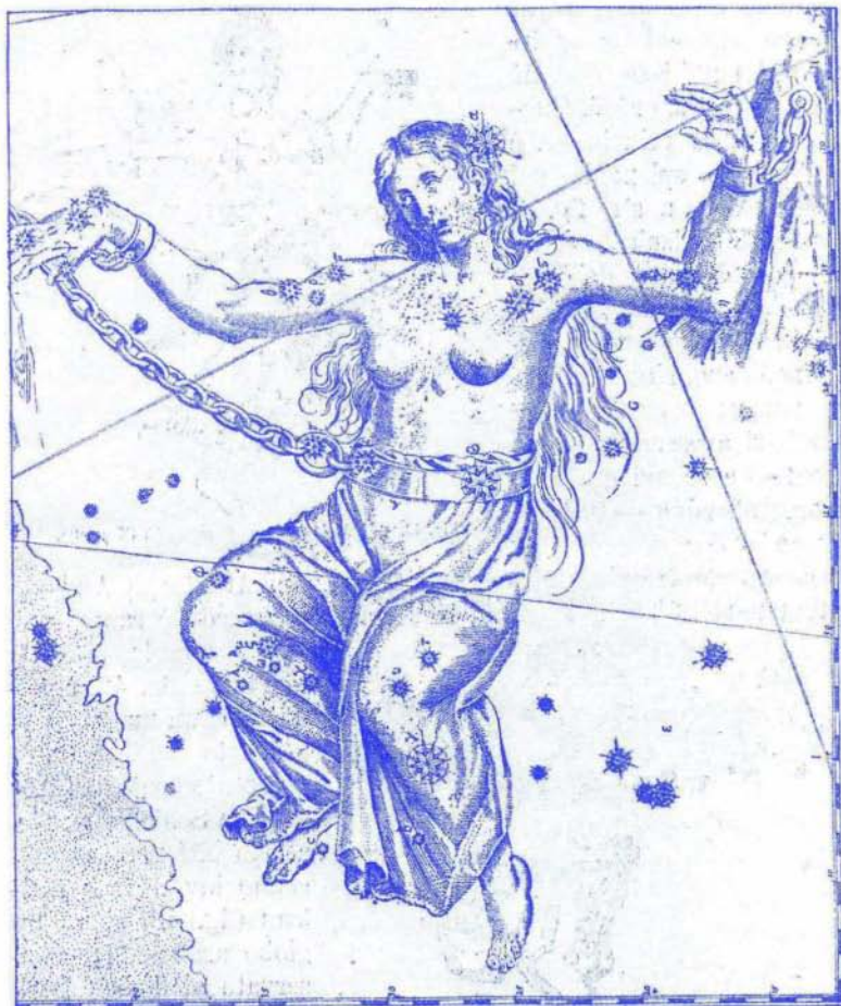
Slika 2. Podoba ozvezdja Andromeda iz Bayerjevega zvezdnega atlasa Uranometrija (1601).

Več kot dvajset let je Tycho Brahe s svojimi sodelavci opazoval zvezde, planete, komete in seveda tudi Luno. Pri Luni je odkril spremembe (nekaž nepravilnosti) v njenem gibanju, za komete pa je dokazal, da se gibljejo dlje kot Luna. Rezultat številnih zvezdnih opazovanj je objavljen Katalog natančnih leg 788 zvezd . To je prav tisti katalog, ki je nemškemu astronomu Johannu Bayerju služil kot osnova za izdelavo zvezdnega atlasa Uranometrija (1603), v katerem so prvič v zgodovini astronomije ozvezdja sistematično prikazana v slikah z mitološkimi osebami oziroma motivi.