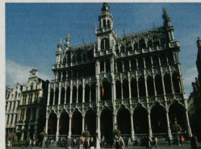
Grand Place, glavni trg Bruslja, se ponaša s čudovitimi stavbami in trgi, z bleščečimi gotskimi, renesančnimi in baročnimi pročelji palač.

Bruselj je upravno, gospodarsko in s številnimi muzeji kulturno središče Belgije. Prijazen voznik našega avtobusa nas je popejljal mimo večjih znamenitosti