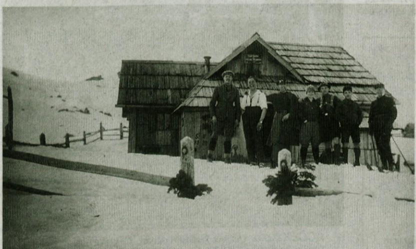
Turistična kočja na Veliki planini v maju leta 1925