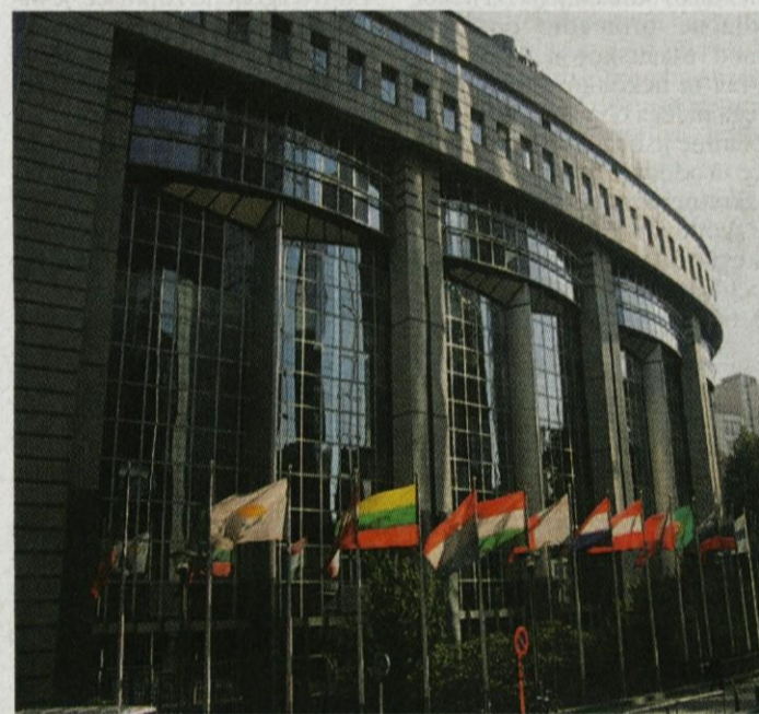
Pred stavbo Evropskega parlamenta v Bruslju med 25 zastavami držav članic vihra tudi slovenska zastava.