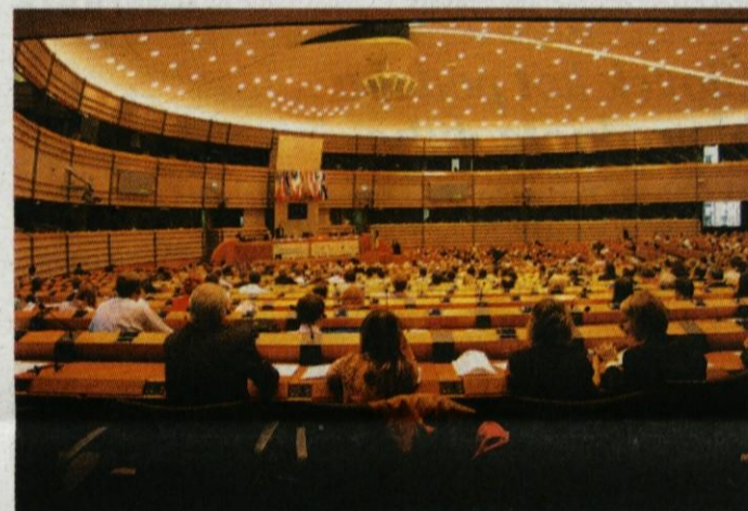
Pokukali smo v veliko dvorano Evropskega parlamenta, kjer je ravno v času našega obiska potekalo zasedanje. Poslanci v sejni dvorani niso razporejeni glede na svojo nacionalno pripadnost, temveč glede na pripadnost politični skupini. Danes je v Evropskem parlamentu sedem političnih skupin in skupina samostojnih poslancev.

Padec berlinskega zidu je končal tisto, kar je Milan Kundera poimenoval »ugrabitev polovice Za-