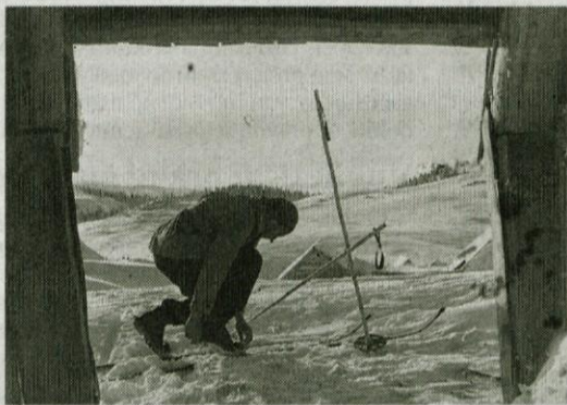
Bajtar si privezuje smuči pred bajto na planini leta 1931

Velika planina, največja planina pri nas, se ponaša z dolgo pastirsko tradicijo. Njena posebnost so vsekar pastirska selišča na Veliki, Mali in Gojski planini, torej pastirske bajte, v katerih pastirji v poletnih mesecih pasejo živino na planini. Nekeč ovalne bajte so danes večino zamenjale oglate, a planina kljub temu deluje svojstveno, saj so bajte še vedno tradicionalno krite s skodlami. Tako se v pastirskem selišču čuti pridih stare arhitekturne dediščine.