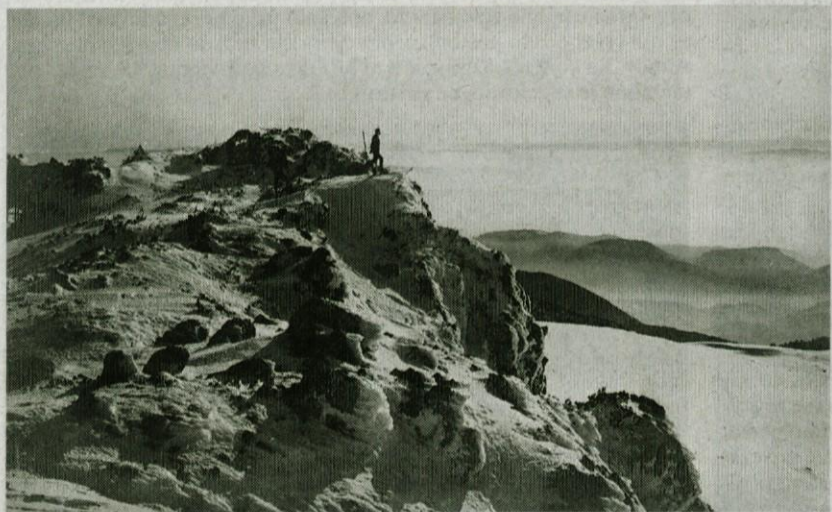
Vrh Njivice (Velika planina)