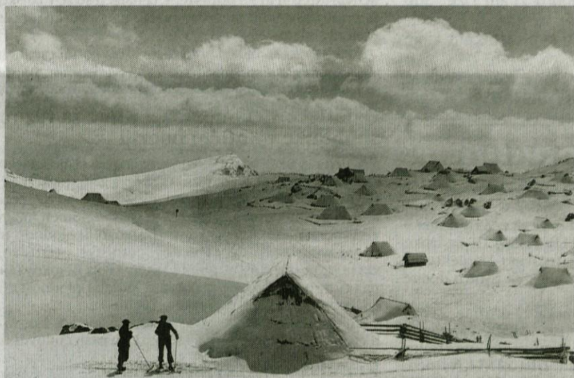
Bela prostranstva na Veliki planini (fotografija iz časa pred 2. svetovno vojno)