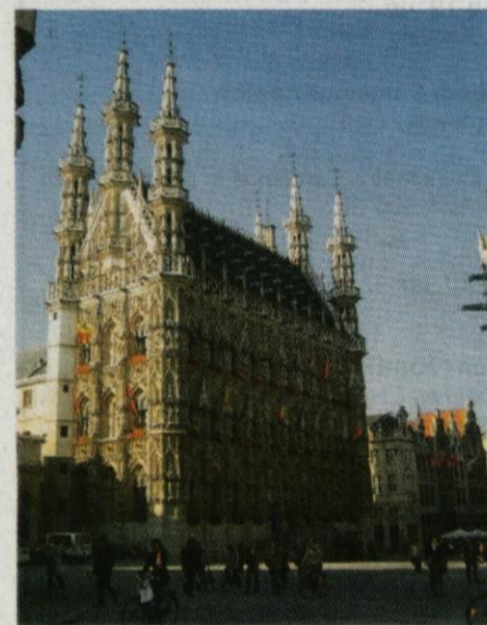
Bogato okrašene stavbe, samostani in cerkve v prijetnem flamskem univerzitetnem mestu Leuven pričajo, da je bilo mesto v srednjem veku pomembno trgovsko središče.