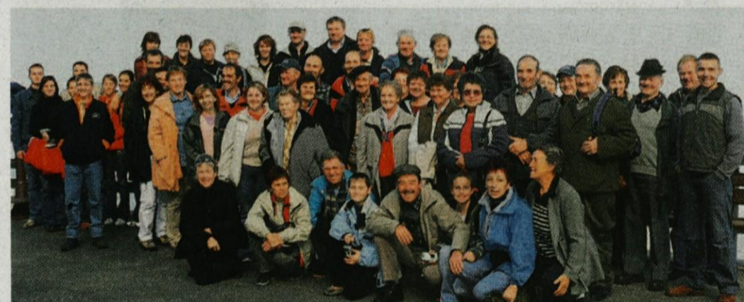
Udeleženci izleta na ploščadi pod Orlovim gnezdom.