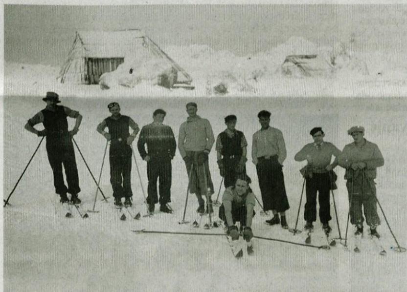
Smučanje na Veliki planini v mesecu maju leta 1925