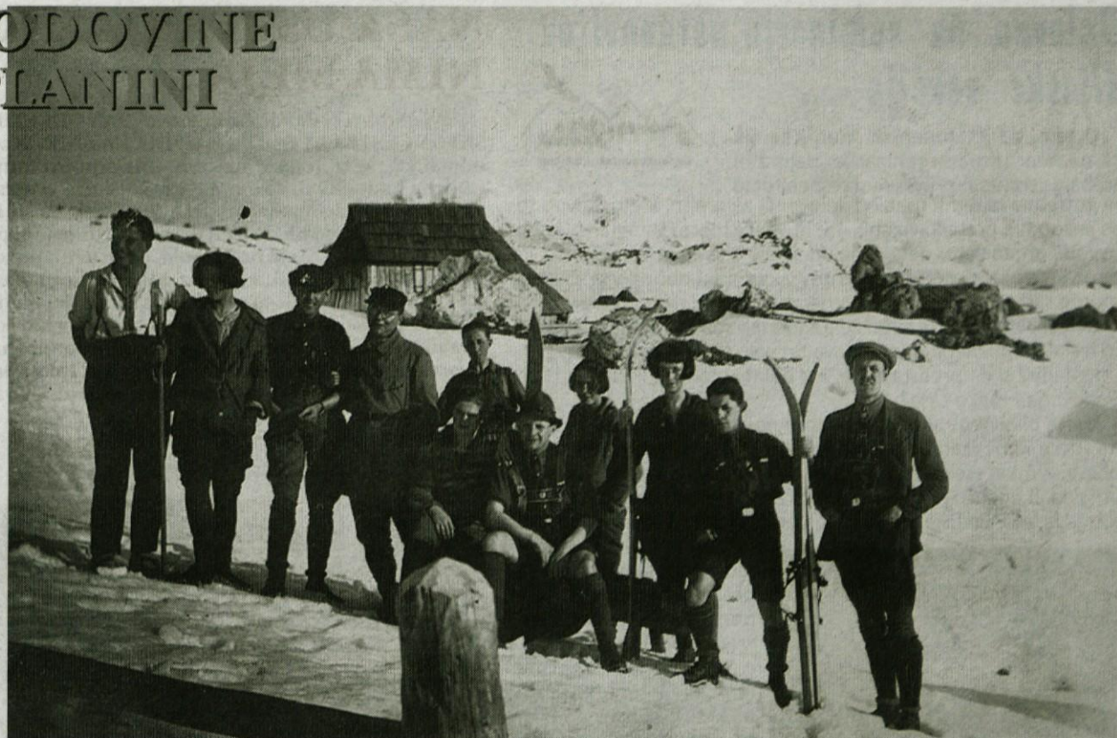
Bajtarji na planini