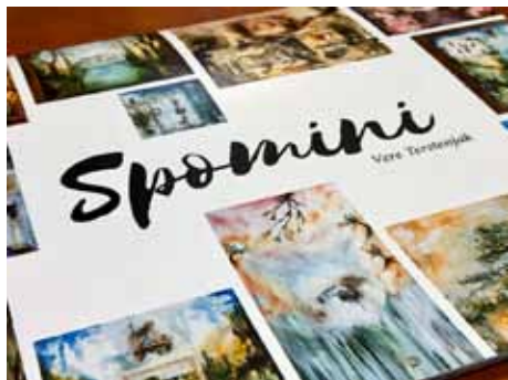
Spomini - cikel slik, ki je nastal med leti 2014 in 2016