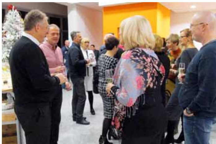
Odlično vzdušje na 1. novoletnem srečanju članov Obrtne zbornice Domžale