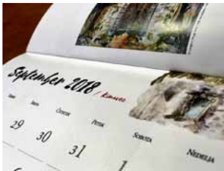
Lepi detajli koledarja

Ena izmed slik, ki krasi koledar za leto 2018, je tudi slika z naslovom Kersnikov grad skozi roza tančico časa – olje na platnu 100 krat 100cm, ki je nastala v letu 2015. Slika govori zgodbo, v kateri je »opapa« Leo kot visoki uradnik po prvi svetovni vojni služboval v gradu na Brdu. Pozneje je, do druge svetovne vojne, prav tu in prav tako kot visoki uradnik deloval tudi avtoričin oče Niko.