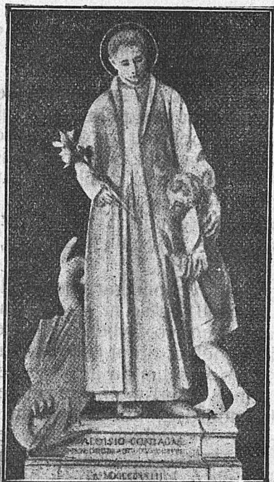
Kip sv. Alojzija — patrona katoliške mladine.