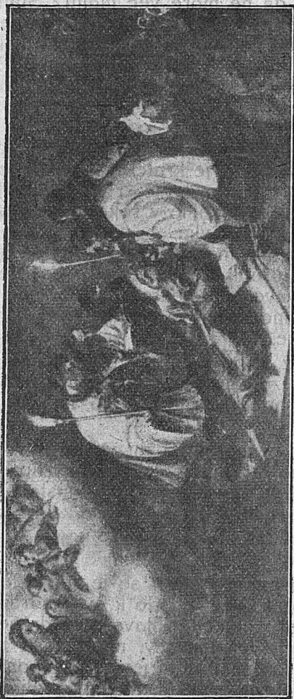
Držeč v eni roki rožni venec a v drugi luč je mirno izdihnil svojo dušo...