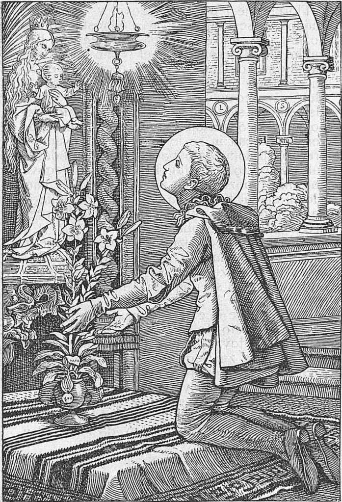
Napravil je v Florenci pred Marijinim kipom obljubo večne čistosti...