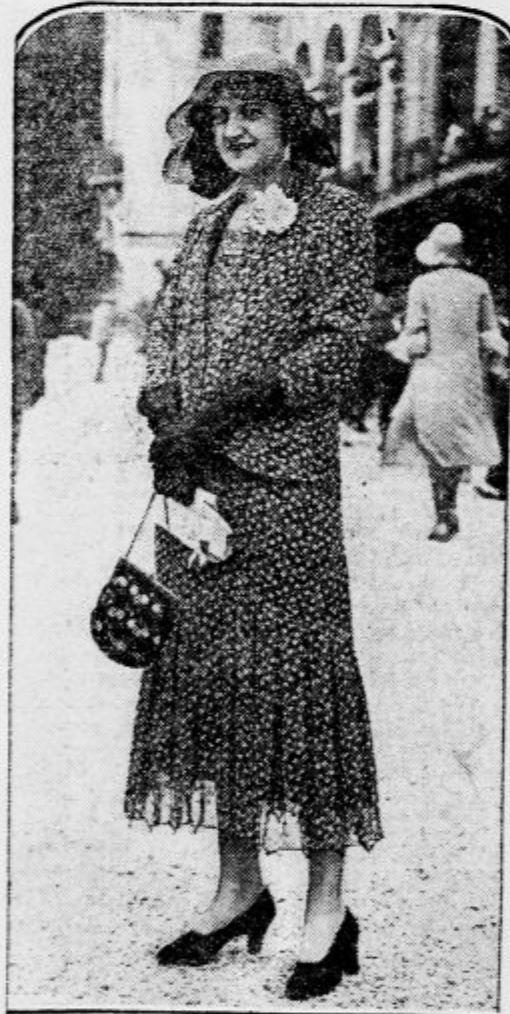
Elegantna pomladanska obleka

vora. Gre samo za tragično ulogo ženske, ki je žrtvovala za pravico do samostojnega življenja najvišjo ceno: pravico do ljubezni, notranjega miru in sreče.